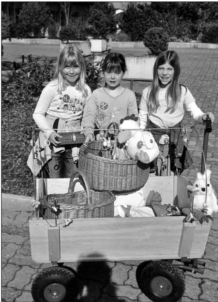
Drittklässler beim Ostereierverkauf.

Im Handarbeitsunterricht wurden 1000 Eier gefärbt und anschliessend von der dritten Klasse und der Pfadi Feuerthalen verkauft.