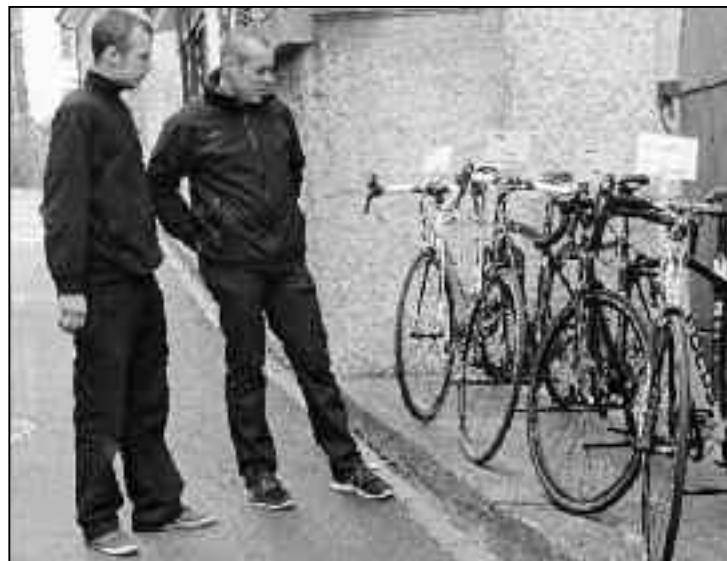
Gute Beratung zahlt sich aus.