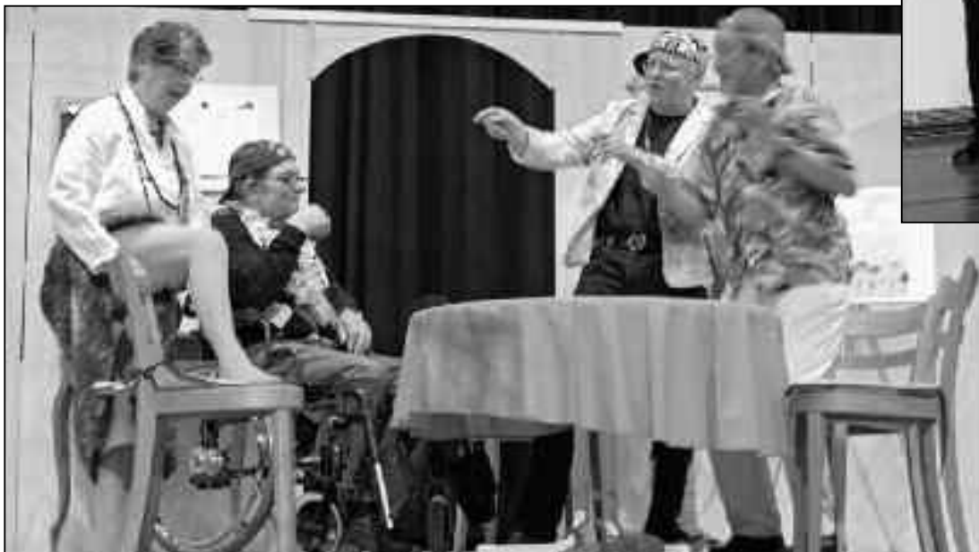
Die Theater-Senioren bringen neuen Schwung ins Altersheim.

Kaufe Altgold, Golduhren, Gold- und Silbermünzen usw. zu Höchstpreisen! Sofortige Barzahlung!