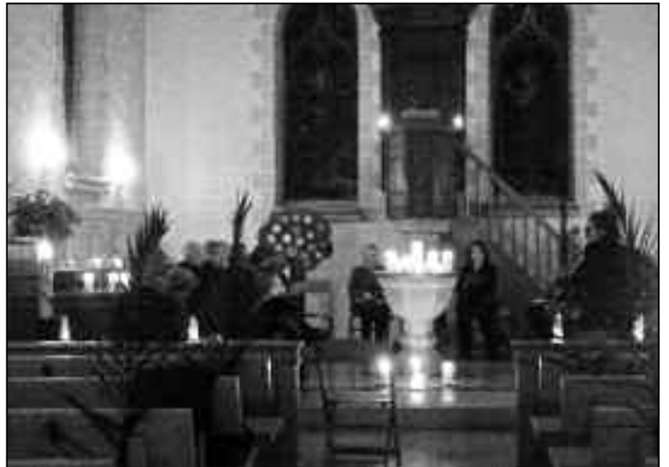
Besinnliche Stunde am Sonntagabend.