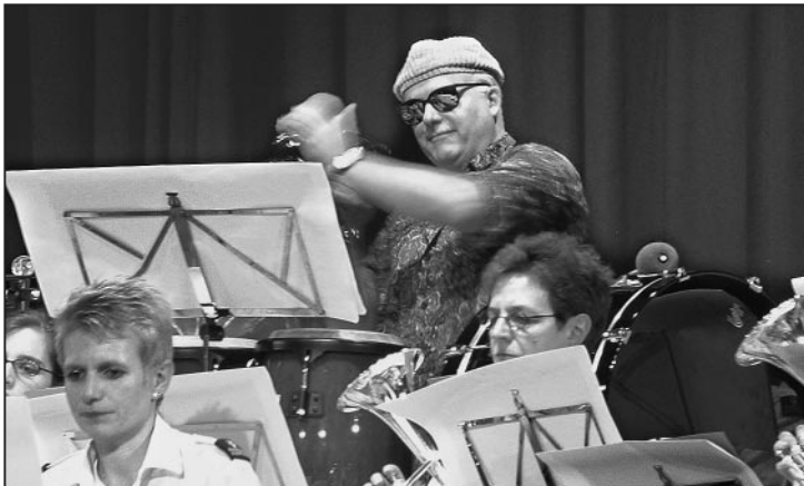
Die Beach Boys lassen grüssen.

Am Abend des 19. Februar zeigten der Musikverein Feuerthalen und die Schülerband der Musikschule Weinland Nord in der gut gefüllten Turnhalle Stumpenboden ihr musikalisches Können.