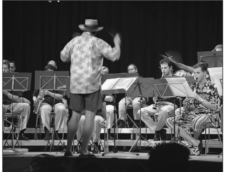
Let's go, surfin' USA...