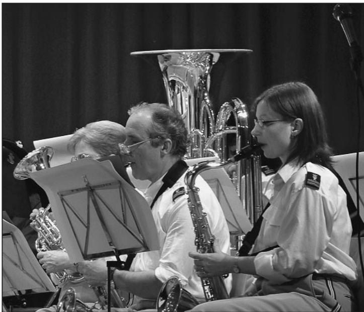
Mit Begeisterung dabei.

Ein Bericht mit Bildern von Cornelia Heil