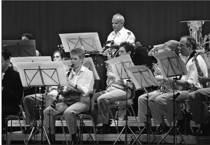
«Ob Walzer oder Rockballade, wir können alles spielen!»

Nach einem weiteren Marsch stand der Boogie «The Fireman» auf dem Programm. Passend dazu hatten die Solisten in diesem Stück einen Feuerwehrhelm auf dem Kopf. Damit entliessen die Musiker die Zuhörer in die Pause, in der Lose ge-