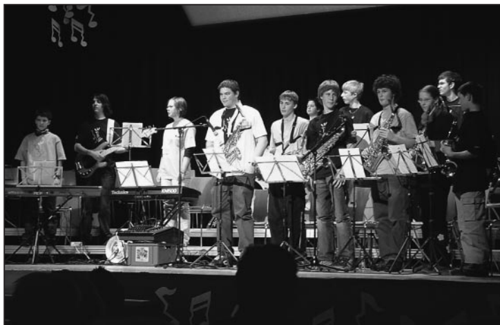
Die jungen Musiker freuen sich über den langen Applaus.