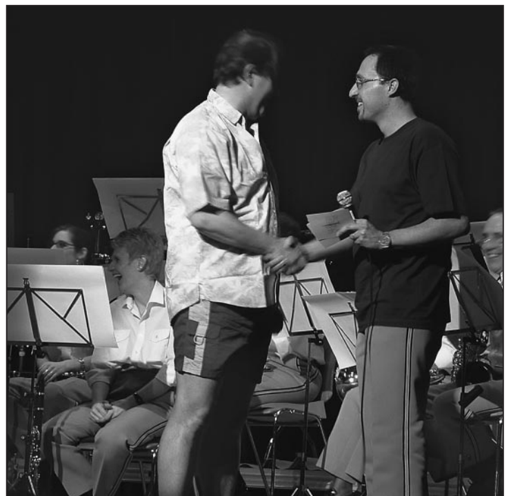
Der Präsident bedankt sich beim Dirigenten für das gelungene Konzert.