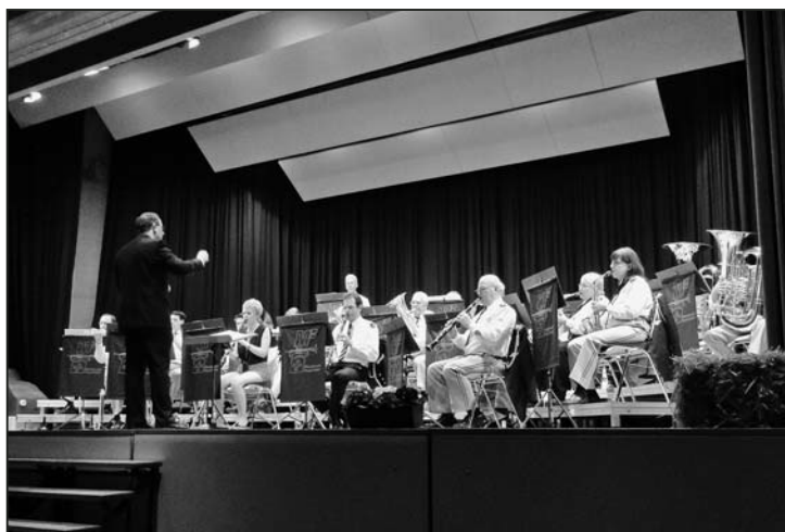
Das Jahreskonzert des Musikvereins Feuerthalen war ein voller Erfolg.

Die Umsetzung des Themas ist den Musikanten mit ihren abwechslungsreichen und unterhaltenden Liedern vollkommen gelungen, und auch durch das lebhaftes Publikum, welches die Musiker tatkräftig unterstützte, hat der Musikverein Feuerthalen einen erfolgreichen Auftritt geboten.