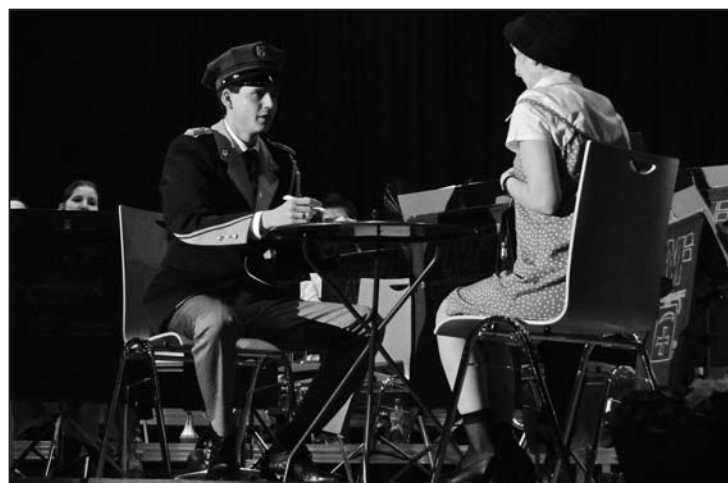
Die charmanten Theaterstückchen waren erfindungsreich vorgetragen und sehr unterhaltsam für das Publikum.