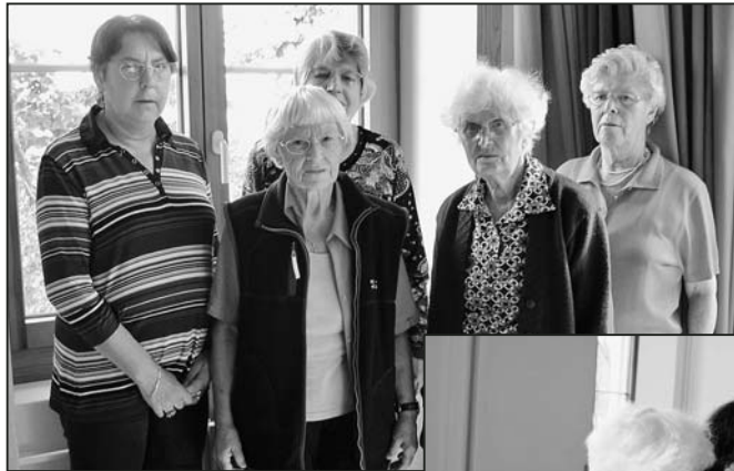
Engagiert und fleissig: Die Damen vom Arbeitskreis.

Der vorweihnachtliche Verkauf von Handarbeiten im Zentrum Spilbrett findet nicht mehr statt, der vertraute Verkaufstand am Suppentag wird nicht mehr aufgebaut. Die fleissigen Hände der Frauen ruhen nun aus. Unzählige Menschen haben dank den warmen handgestrickten Socken keine kalten Füsse mehr oder können sich in eine warme Woldecke einkuscheln. Mit den vielen Pullis, Jäckli, Kindersachen, Adventsgestecken, Karten und, und, und ... sind grosse und kleine Kunstwerke entstanden. Stets arbeiteten die Frauen uneigennützig, der Erlös kam immer einer wohltätigen Institution zugute.