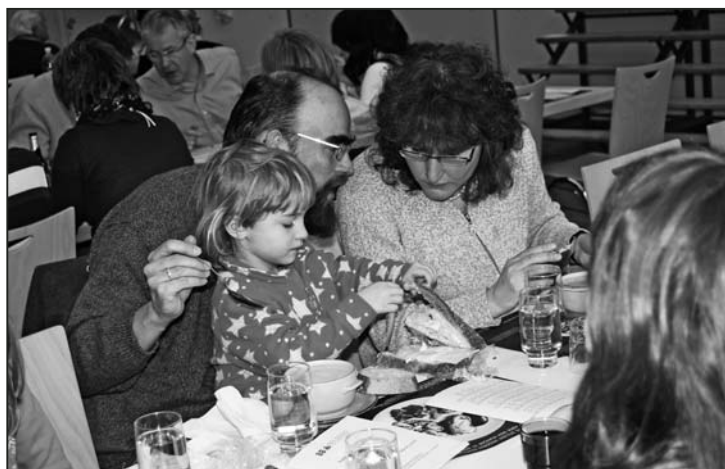
Gesunde Kost für Gross und Klein.

«nur» gegessen. In der guten Atmosphäre entstanden unter den Anwesenden angeregte Gespräche. Zusammen mit der Tatsache, dass der Anlass einem guten Zweck dient, kommt man als Besucherin unweigerlich zum Schluss: Der Suppentag 2011 war ein voller Erfolg. Es ist schön, dass es in unserer Gemeinde solche Anlässe gibt.