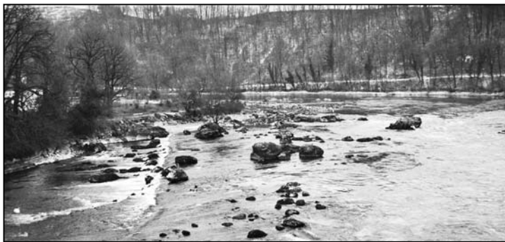
Das ausserordentliche Niedrigwasser lässt in der Rheinbiegung direkt oberhalb des Rheinflalls sehr viele Steine sichtbar werden.