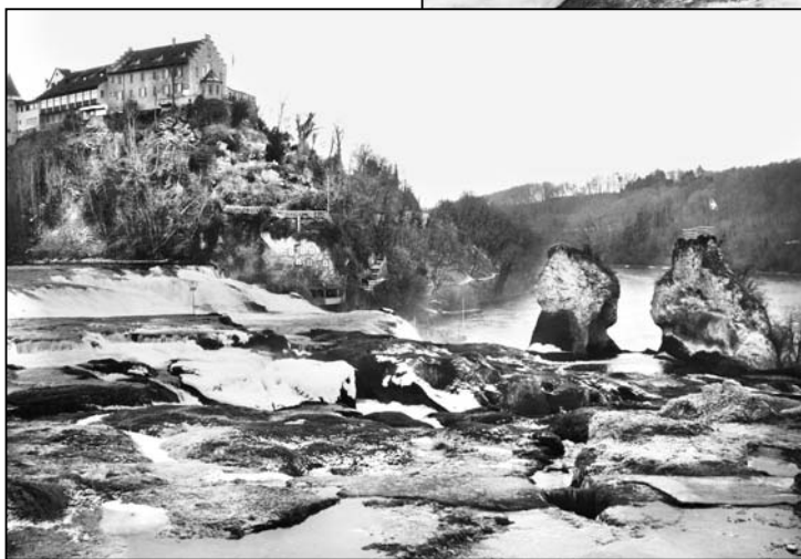
Auf der Neuhauser Seite ist der sonst so imposante Wasserfall fast zu einem Rinnsal geworden. An den «freigelegten» Felsen ist die Macht des Wassers zu sehen. Die tägliche Arbeit des Wassers hat die Felsen an den entsprechenden Stellen abgeschliffen.