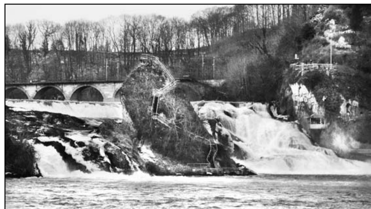
Der Rheinflall in der klassischen Ansicht vom Neuhauser Ufer aus. Der Felsen wird nur noch auf der einen Seite von grösseren Wassermassen umspült.