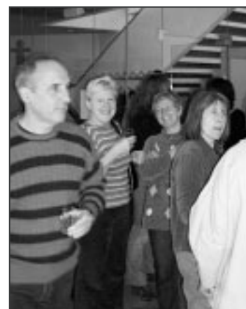
Fröhliche Gesichter nach Happy End.