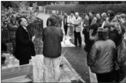
Behördenmitglieder und Sponsoren – aufmerksame Zuhörer bei der «Taufrede» des Gemeindepräsidenten.

Mit der Sanierung des Stadtweges in Feuerthalen galt es, einerseits die Bushaltestelle gegenüber dem Restaurant „Schwarzbrünneli“ (oder was davon noch übrig ist) und andererseits das unbenutzte Dreieck zwischen Stadtweg und Feldstrasse neu zu gestalten.