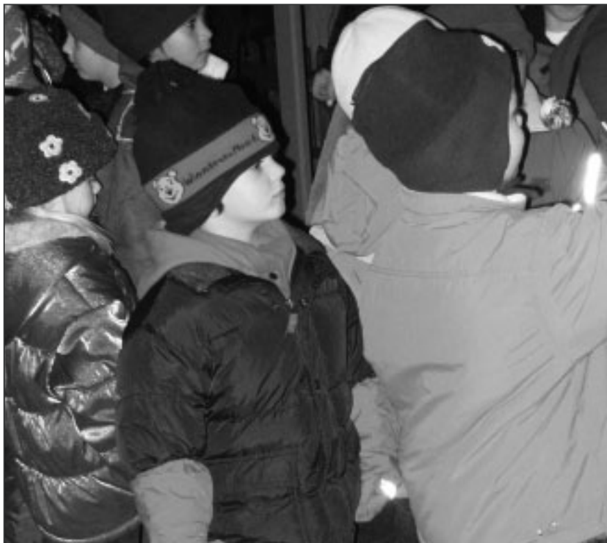
Wann gehts denn endlich los?