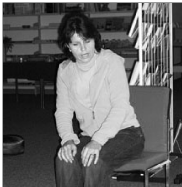
Märlitanten in Aktion.