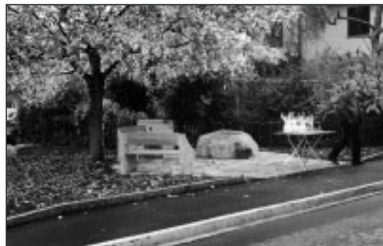
Eine schöne Anlage ist bereit für die Einweihung.