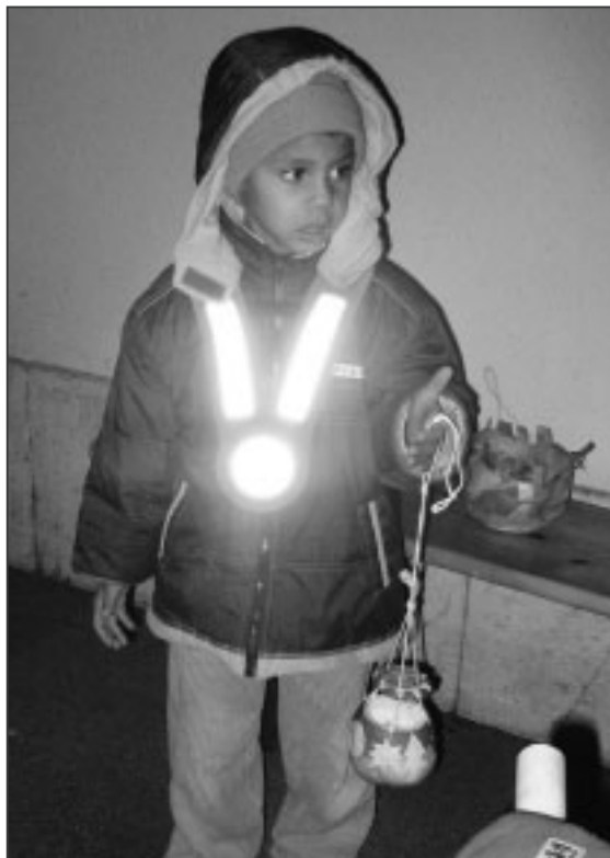
Laterne, Laterne, Sonne, Mond und Sterne...

Pünktlich zum Räbeliechtliumzug schickte Petrus der Jahreszeit entsprechend kalte Temperaturen. Die Langwieser Kinder besammelten sich vor dem Kindergarten, der von warmem Laternenlicht beleuchtet war. Die Kindergärtler hatten die roten, orangen und gelben Sonnen- und Sternen-Laternen für diesen besonderen Abend gebastelt.