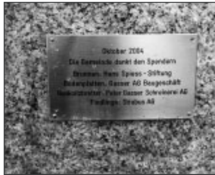
Eine Tafel am Brunnen erinnert an die Einweihung und an die Sponsoren.