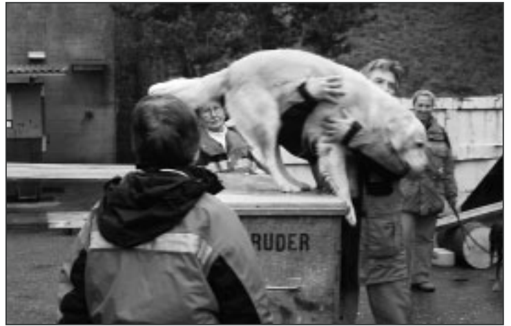
Vielfältiges Können der Katastrophenhunde.