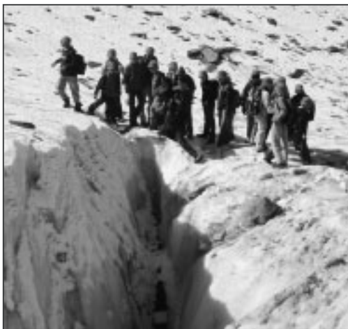
Der Blick in die Gletscherspalte.