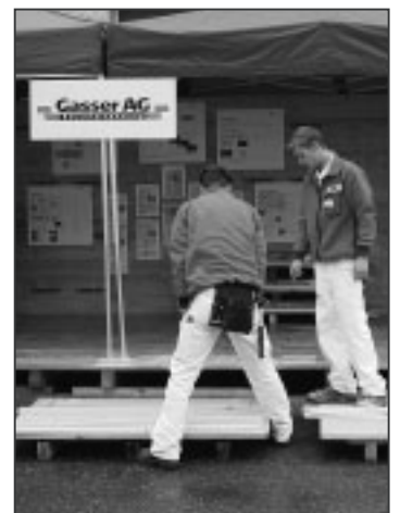
Mit Spass an der Arbeit.