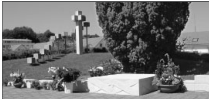
Das Gemeinschaftsgrab: Alte und neue Elemente bilden eine Einheit.

Zwei Bänder, jedes für sich, die in sich verlaufen und zugleich eine Einheit darstellen, symbolisieren die Gemeinschaft. Der Künstler verwendete einen französischen, sehr kompakten Kalkstein mit dem Namen Comblancien, der das Motiv sehr gut wiedergibt. Franco Fregona sagt zu seinem Werk: «Immer wieder ging ich auf den Friedhof und stellte mir meine verschiedenen Entwürfe zusammen mit dem ganzen Umfeld vor, bis ich auf die Idee mit den Kalksteinquadern kam. Es sollte den ganzen Platz mit einbeziehen, leicht und locker