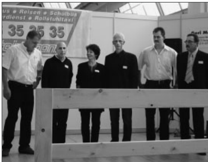
Das OK der diesjährigen Gewerbeausstellung.

Am Freitag, dem 8. Oktober wurde die G04 im Gewerbezentrum Arova eröffnet. Die Ausstellung stiess bei der Bevölkerung auf reges Interesse.