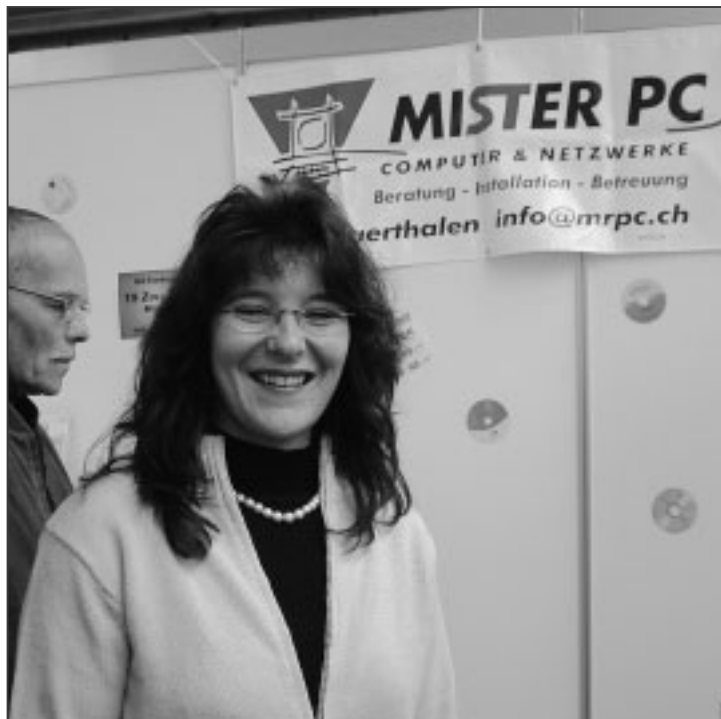
«Wir lösen auch Ihr EDV-Problem».

kundenspezifischer Einzelteile und verkaufsfertig verpackter Baugruppen ist.