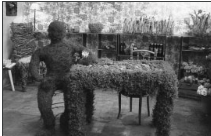
Der Wurzelsepp am Efeutisch.