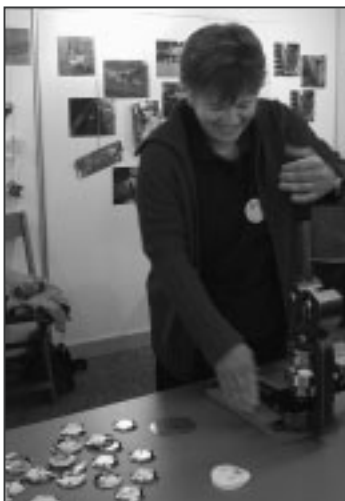
Buttons für eine saubere Gemeinde.

zahlreiche Besucher anlockte. Fotografiert wurden die Besucher mit den digitalen Profikameras der Firma Sinar AG, die auch vielseitiger Zulieferer