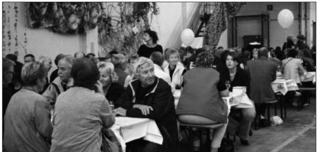
In der Festwirtschaft herrschte Hochbetrieb.

zahlreiche Besucher anlockte. Fotografiert wurden die Besucher mit den digitalen Profikameras der Firma Sinar AG, die auch vielseitiger Zulieferer