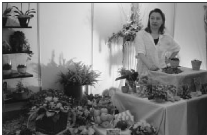
Herbstzauber in der Gärtnerei Fischer.