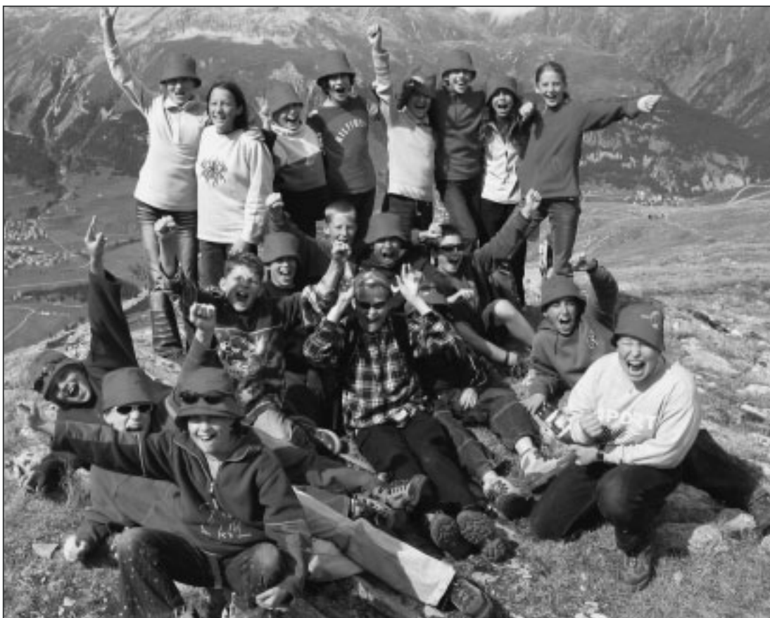
Der Aufstieg ist geschafft!

Wir mussten um 8.00 Uhr aufstehen. Es erwartete uns ein neuer Tag in Celerina. Nach dem Morgenessen erfuhren wir, dass wir das Römerbad besuchen würden. Ein grosses Jubeln ging durch den Saal. Nun mussten wir unsere Zimmer aufräumen und unsere Taschen für die Reise packen. Endlich waren wir marschbereit. Wir machten uns auf den Weg zum Bahnhof. Kurz darauf traf der Zug ein. Dann stiegen wir ein. Bei Samedan haben die Leiter geschlafen, und wir sind zu weit