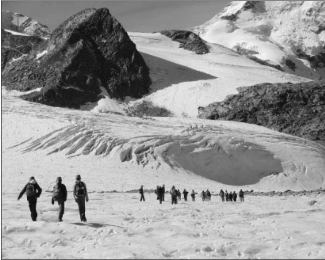
Wanderung über den Morteratschgletscher.

Vom 18. bis 24. September verbrachte die Klasse von Herrn Coviello vom Schulhaus Stumpenboden eine abwechslungsreiche Lagerwoche.