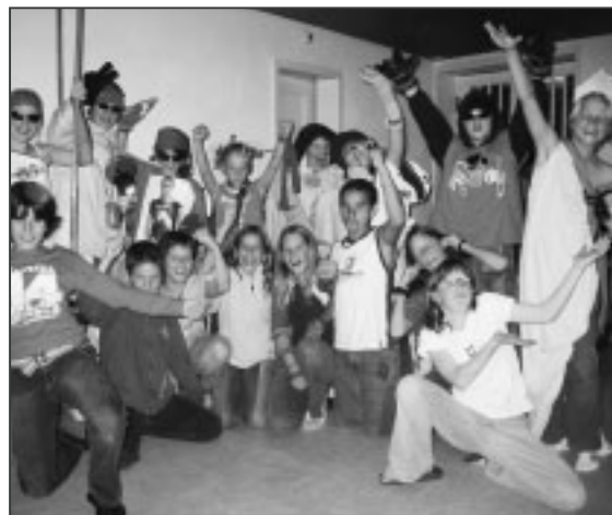
Gute Laune im Haus «La Margna».

gefahren. Also stiegen wir in Bergün aus und fuhren zurück nach Samedan. Dort wurden wir von zwei kleinen Bussen erwartet und fuhren nach Scuol ins Römerbad. Da war es mega cool! Es hatte ein Dampfbad und gleich nebenan ein Salzbad. Im Dampfbad war es warm. Vor allem zuoberst. Im Salzbad konnte man sich einfach auf der Oberfläche treiben lassen. Schon bald mussten wir das Bad wieder verlassen. Wir stiegen in die Kleinbusse ein und fuhren zurück nach Celerina. Dort erwartete uns ein feines Nachtessen.