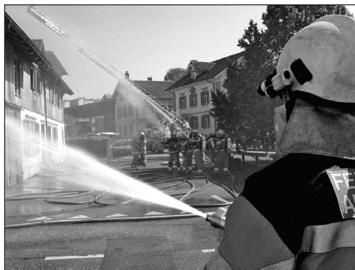
Feuerbekämpfung aus allen Rohren.

Wäre 2009 die Vorlage «Eimündung Bahnhofstrasse in die Diessenhoferstrasse» von der Einwohnergemeinde angenommen worden, so hätte man die ehemalige Malerwerkstatt an der Schützenstrasse bereits abgebrochen. Gerade in diesem nun leer stehenden Haus haben sich Studenten eingenis-