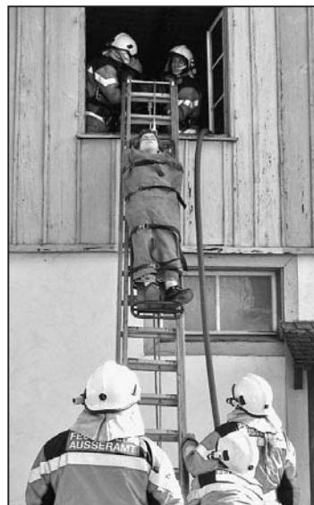
Anspruchsvolle Bergung eines Verletzten.

tet. Nicht gerade wählerisch mit Komfortansprüchen, sind die übrig gebliebenen Restfarben- und Lösungsmittelbehälter Teil einer nicht normalbürgerlichen Raumausstattung geworden. So stellte es sich bei einer späteren Befragung heraus. Beim übermütigen Rezitieren des Oldie-Ohrwurms, als eine Art Hommage an die Behausung, «Das alte Haus von Rocky-Docky hat vieles schon erlebt, kein Wunder, dass es zittert, kein Wunder,