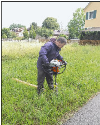
Begonnen auf der grünen Wiese: Zuerst einmal musste gemäht und eingezäunt werden...