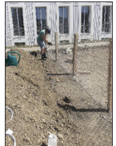
... und nicht zuletzt auch das Hasengehege eingerichtet.