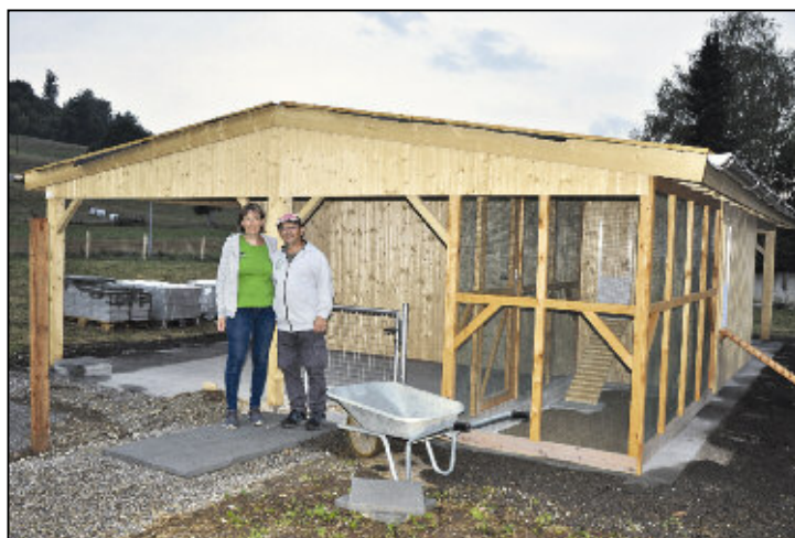
Jetzt ist fast alles bereit für den Einzug der Tiere.