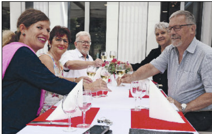
Lasst die Gläser klingen um auf die Laudatio einzustimmen.

8 Jahre Katechetin in der katholischen Kirche, 10 Jahre bei der katholische Kirchenpflege als Aktuarin und im Archiv tätig, 28 Jahre Mitglied im Wahlbüro Feuerthalen, 5 Jahre Haushilfe und Aushilfe als Feri-