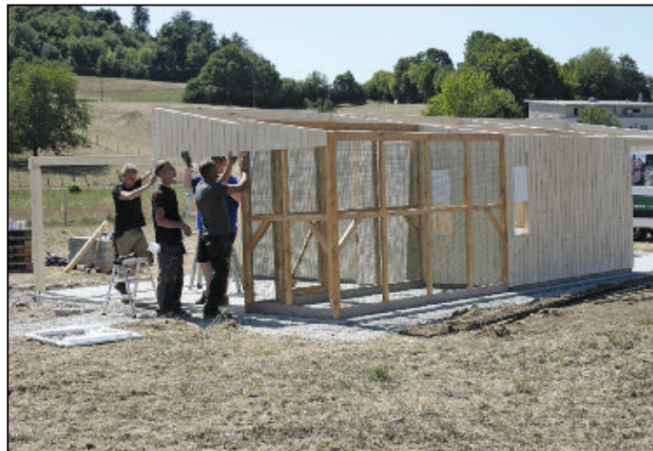
... dann wurde der Stall aufgerichtet ...