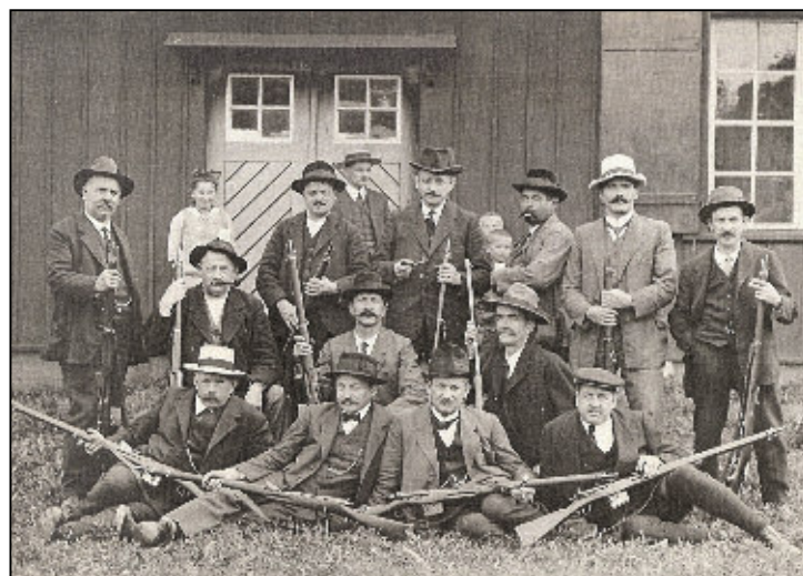
Die Standschützen um ca. 1930: Das Schiessen war damals noch der Hauptvereinszweck.

Wer Mitglied bei der Standschützengesellschaft Feuertha-