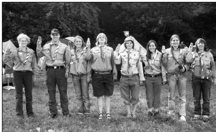
Allzeit bereit: Leiter(innen)equipe in Kandersteg.