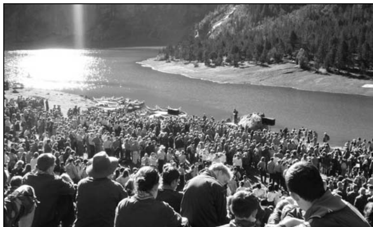
Pfadis aus der ganzen Welt in ihrer traditionellen Uniform.