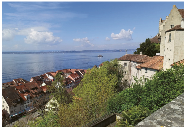
Herrliche Aussicht auf den Bodensee.