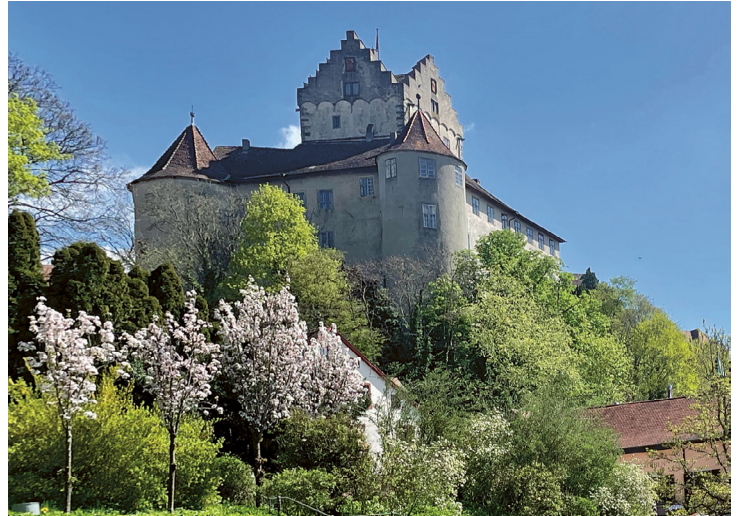
Das Schloss Arenenberg ist einen Besuch wert.

Beeindruckt reisen wir mit dem Car weiter nach Konstanz und dann mit der Fähre nach Meersburg. Dort erwartet uns