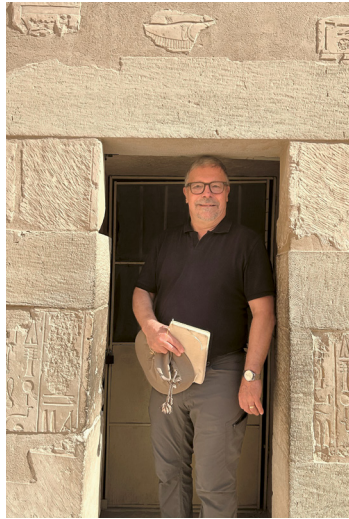
Im Land der Pharaonen.