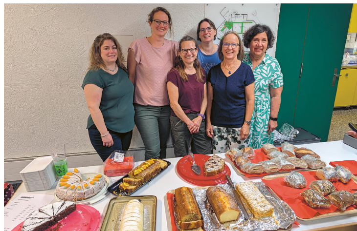
Für das leibliche Wohl der Besucherinnen und Besucher sorgte der Frauenverein mit einem liebevoll vorbereiteten Buffet.

mer noch nicht satt wurde, sei an dieser Stelle nicht verraten. Das Publikum musste allerdings weder Hunger noch Durst leiden. Der Frauenverein Feuerthalen-Langwiesen sorgte mit einem reichhaltigen Buffet dafür, dass vor, während und nach der Vorstellung keine kulinarischen Wünsche unerfüllt blieben. Ob sich auch Truffaldino im Anschluss an die Vorstellung eine wohlverdiente Stärkung gönnen durfte, entzieht sich der Kenntnis der Redaktion. Das Theater Kanton Zürich gastiert mit dem Stück «Der Diener zweier Herren» noch bis Mitte September an verschiedenen Orten im Kanton.