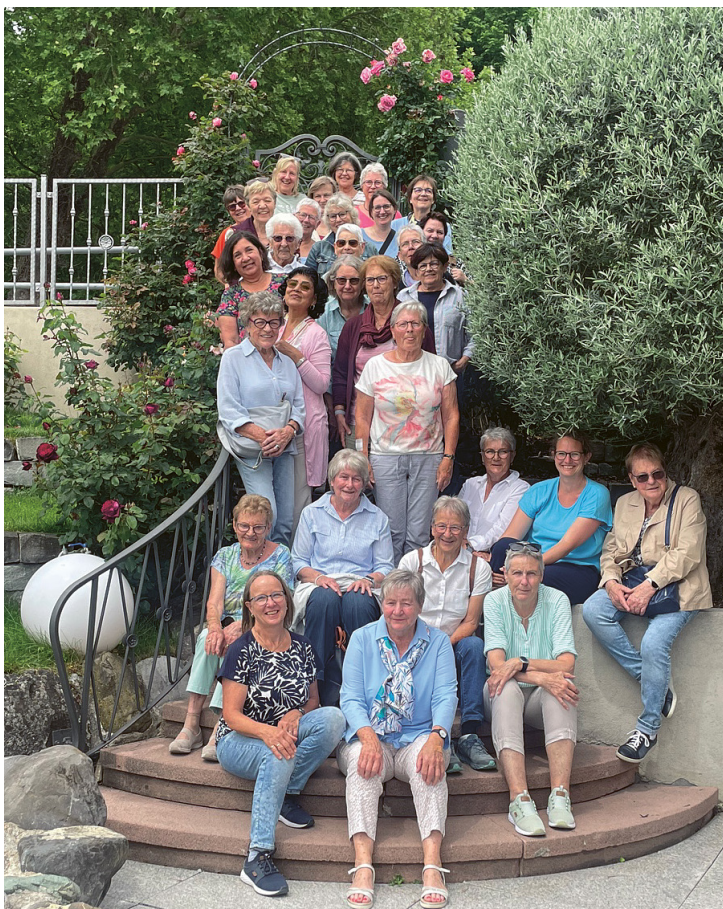
30 muntere Frauen unterwegs.

im Restaurant «Wilder Mann» direkt am See ein liebevoll gedeckter Tisch, ein wundervolles Mittagessen und super freundliche und zuvorkommende Bedienung! Wir fühlen uns selbst wie Fürstinnen in den Ferien und geniessen diese wunderbare Ambiente.