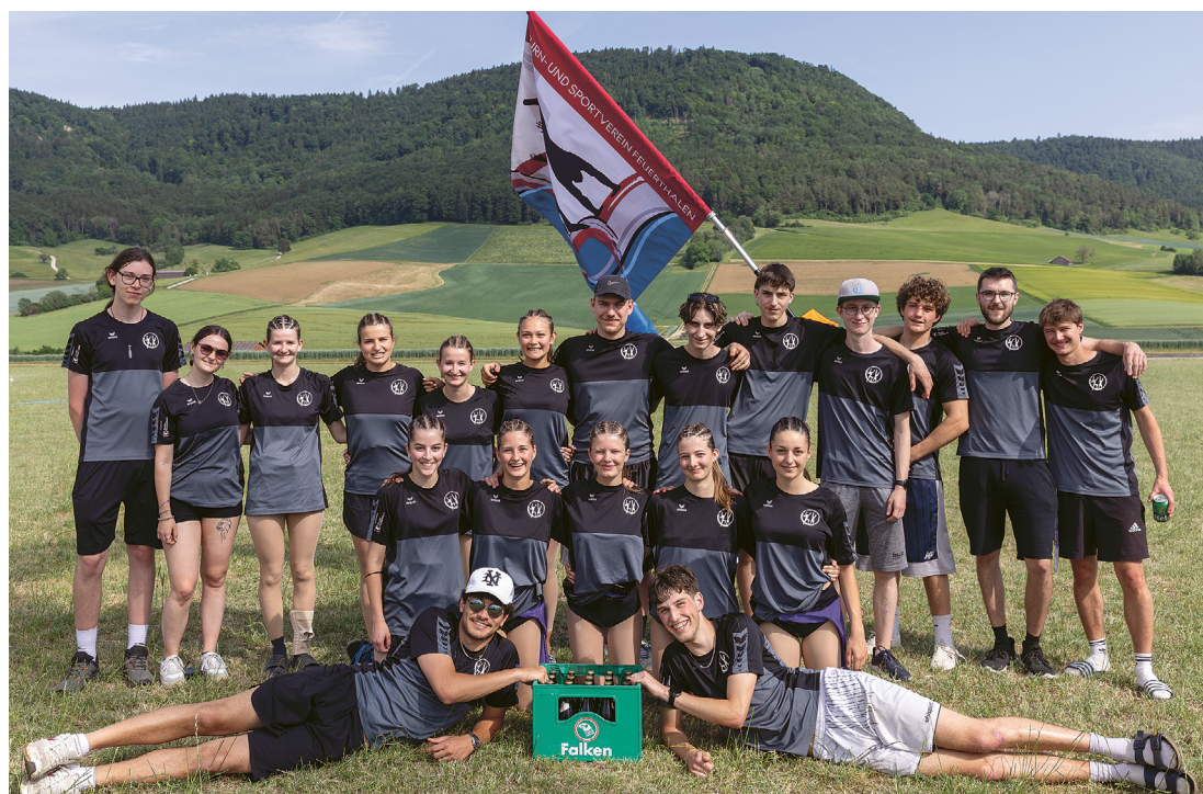
19 Turnerinnen und Turner unserer Aktivriege mit Leiterinnen und Leiter.

Am 27. Juni folgt mit dem Plausch-Volleyballturnier schon der nächste grosse Anlass für unsere Aktivriege. Diesmal im eigenen Dorf und mit dem erhofften Heimvorteil. Wir freuen uns auf viele Zuschauer um 14.00 Uhr im Stumpfenboden!