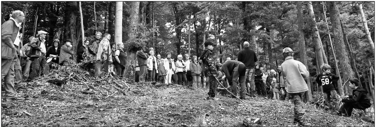
Gross und Klein: Zahlreiche interessierte «Waldbegeher».

Übergeordnet untersteht das Revier der Baudirektion des Kantons Zürich. Ein wichtiges Instrument zur Gestaltung des Waldes von morgen ist der neue Waldentwicklungsplan,