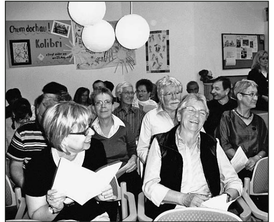
So macht Singen sichtlich Spass.

Im Namen aller eingeladenen Freiwilligen möchte ich mich