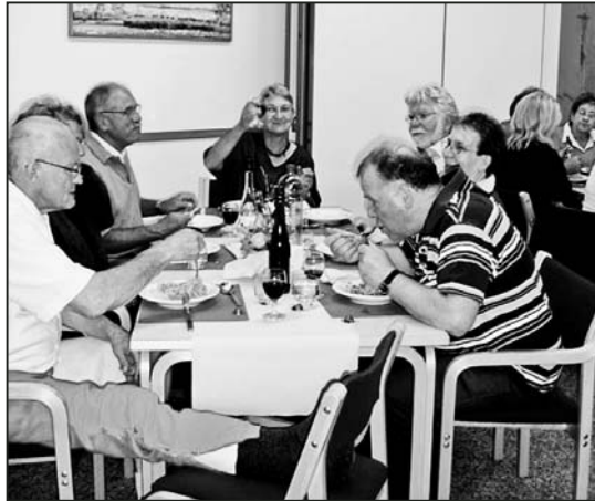
Ein Prost auf die Geselligkeit.

Wer sich trotz dem abendlichen, starken Gewitter im Zentrum Spilbrett eingefunden hatte, wurde zuerst mit einem Apéro aus frischer Rohkost (Karotten-, Kohlrabi- und Peperonistäbchen), zu welcher feine Dipsaucen angeboten wurden, empfangen, und man lernte sich beim munteren Smalltalk näher kennen. Es waren 63 Personen, welche der Einladung gefolgt waren. Diese kamen aus allen möglichen Sparten der Freiwilligenarbeit, so zum Beispiel vom Senioren-