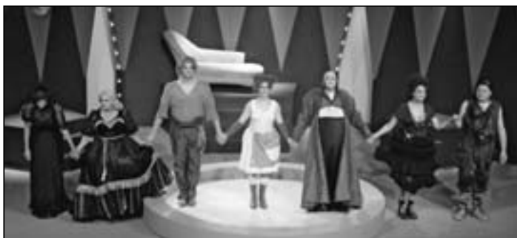
Das Schauspielensemble vor dem farbigen Bühnenbild.

gäste von auswärts anwesend. Dieses Jahr fanden sowohl die Proben für das neue Stück als auch die Premiere in der Mehrzweckhalle Stumpfenboden statt. «Der Talisman» wird bis im August an diversen Orten im Kanton Zürich aufgeführt. Den Spielplan findet man unter www.theaterkantonzuerich.ch . Wie immer bei Stücken vom Theater Kanton Zürich können Sie sich auf einen gelungenen, fröhlichen Abend freuen.