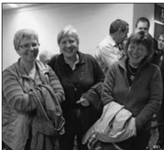
Drei Feuerthalerinnen nach der Premiere.