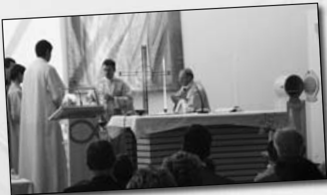
Weihrauch gehört zur Weihe.

Auch die Kinder fühlen sich wohl: Sie basteln, spielen, geniessen das Essen und das Zusammensein.