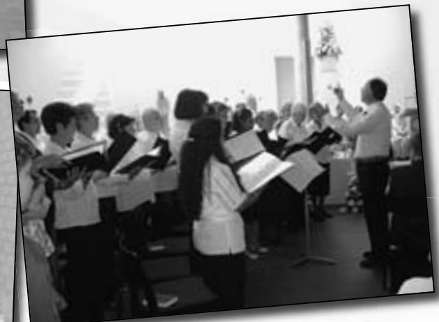
Kirchenchor mit Dirigent.