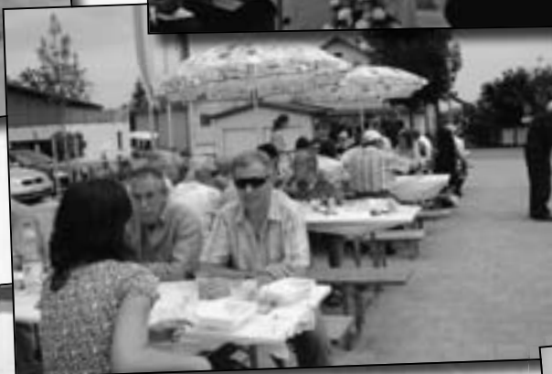
Uns geht es gut.