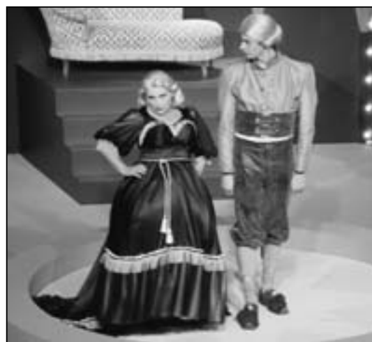
Fotos: ds. Frau von Cypressenburg und der hier blonde Titus Feuerfuchs.

zuerst jedoch ab. Nach Titus' Höhenflug in gesellschaftlichen Schichten, in die er nicht gehört, besinnt er sich auf seine wahre Identität, nimmt Salome zur Frau und erhält von seinem weich gewordenen Onkel ein Barbiergeschäft.