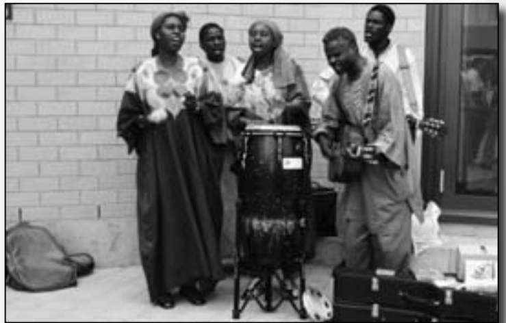
Gospeltöne von den Kuziem Singers.

gesalbt. Durch diese Handlung wird der Altar freigegeben.