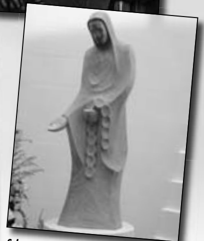
Schutzpatron heiliger Sankt Leonhard.