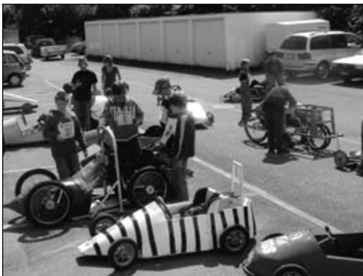
Wir erwarten auch dieses Jahr wieder die tollsten Modelle.

Die organisierenden Vereine: Ortsverein Langwiesen Hilariverein Langwiesen