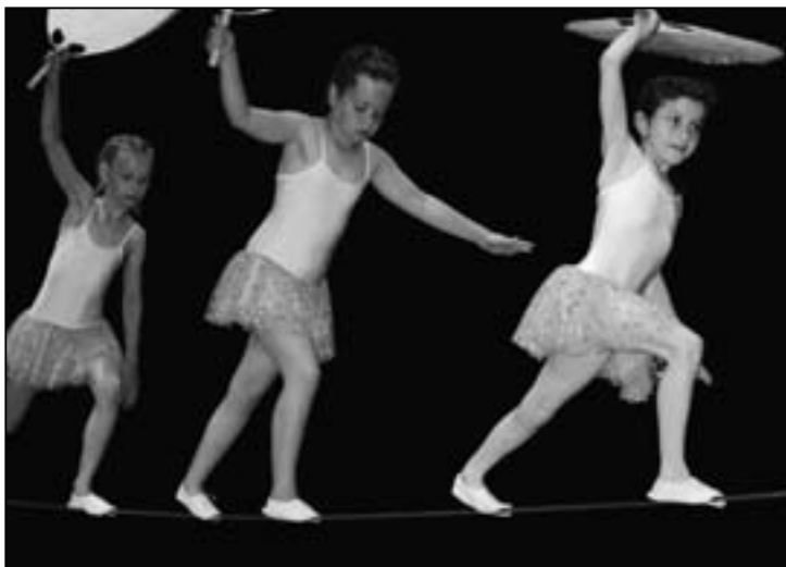
Ja nicht danebrentreten!

er restlos. Wie es sich für einen richtigen Zirkus gehört, sorgten natürlich auch Clowns dafür, dass die Lachmuskeln ebenfalls beschäftigt waren. Sogar ein Elefant hätte auftreten sollen, aber leider sind die Eingänge der Halle nicht für solch grossen Besuch vorgesehen, und so gelang es dem riesigen Grautier lediglich, seinen Rüssel auf die Bühne zu strecken und die Senioren auf diese Weise zu begrüßen.