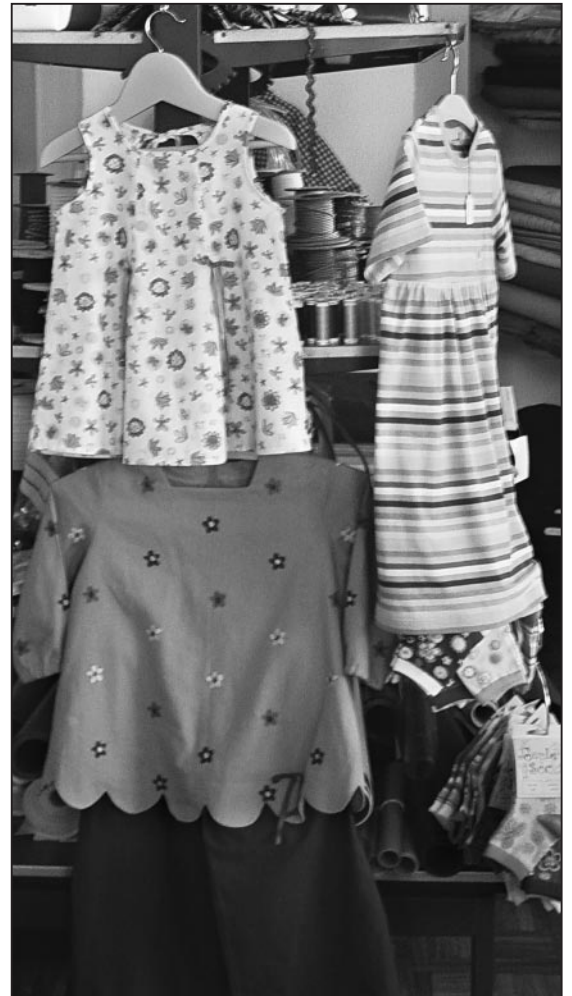
Einzelstücke liebevoll genäht!