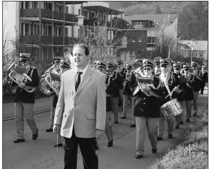
Unser lokaler Musikverein macht immer eine gute Figur.