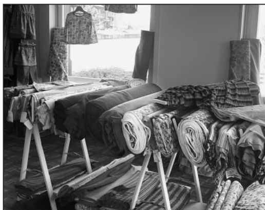
Stoffe in allen Mustern und Farben.