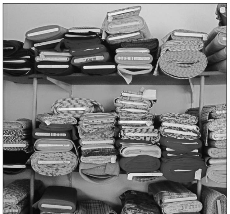
Stoffe so weit das Auge reicht.

Im Hintergrund, auch das braucht es, arbeitet Sepp Signer. Er ist für das Etikettenducken, Rechnungschreiben und Pflegen der Website zuständig. Schauen Sie doch mal rein, entweder an der Lindenstrasse oder unter www.stoffart.ch . Es lohnt sich!