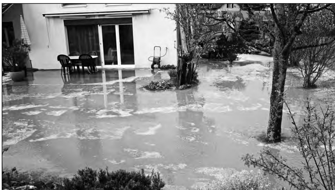
«Einfamilienhaus mit Seeanstoss» an der Toggenburgstrasse.

Zu den Schäden an Wegen und Strassen meint der Feuerthaler