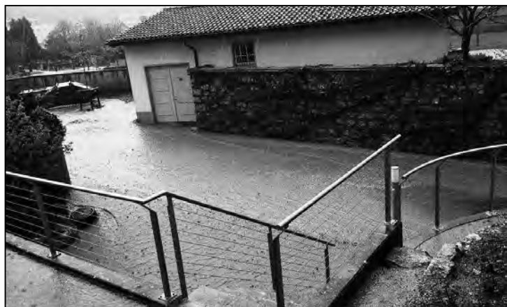
«Land unter» beim Friedhofeingang.