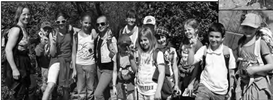
Ausflug ins Mittelalter: Die «Domino»-Kinder auf der Kyburg.

Auf einer Zeitreise gibt es immer etwas zu tun.