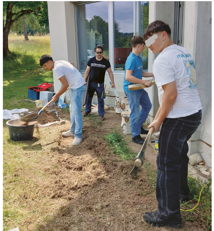
Sek. Wahlfach TTG übernimmt den Treppenbau für den Gartenzugang.

Die Zusammenarbeit ist eng und wertschätzend. Ich sehe jede Disziplin als Stärke unseres integrativen Schulsystems. Mit den Lehrpersonen spreche ich sowohl in geplanten Austauschgefässen als auch informell beim Kaffee in der grossen Pause.