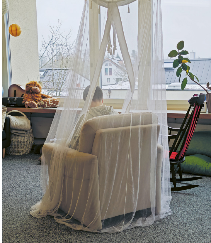
Lernen, lesen oder eine Auszeit nehmen.

Sehr präsent bleibt mir auch das gemeinsame Projekt Adventsfenster mit Schülerinnen und Schülern der ganzen Primarschule: Ein Abend, an dem die Schulinsel ein Ort der Begegnung und Freude war.