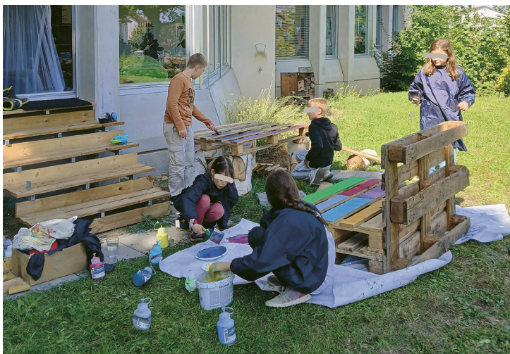
Kreativer Möbelbau für den Schulinsel-Garten.

Auch hier ist Vielfalt Programm: Manche kommen zwischen 5 bis 30 Minuten. Die meisten bleiben eine bis zwei Lektionen pro Aufenthalt. Ver-