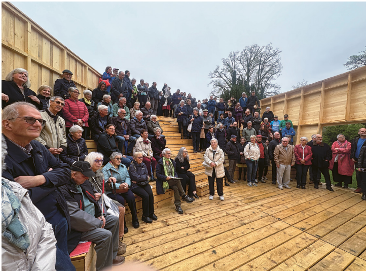
60 Personen finden auf der Tribüne im Inneren der «Arche 2.0» Platz. Tiere waren dieses Mal – abgesehen vom «Grünen Güggel» – keine an Bord.

Mit dem «Grüner Güggel»-Zertifikat haben sich die beiden Kirchengemeinden verpflichtet, ihre ökologische Verantwortung wahrzunehmen. Die reformierte Kirche von Laufen am Rheinflall hat dazu bereits das erste grosse