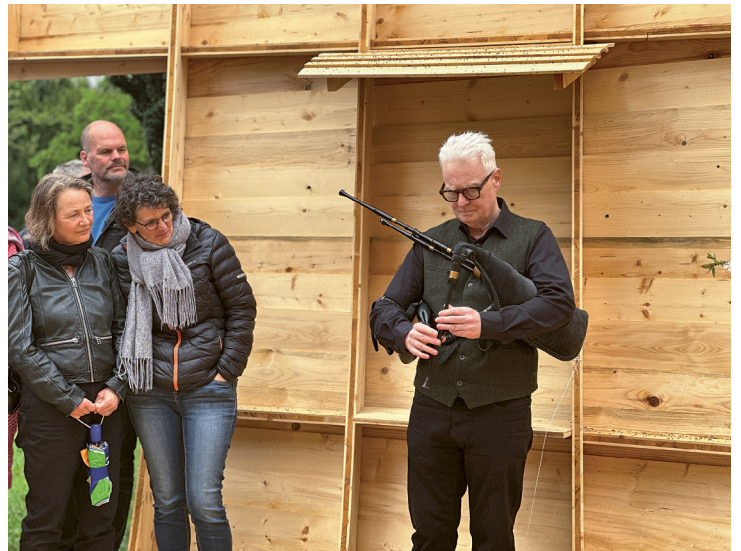
Ein Dudelsack sorgte für die musikalische Begleitung.

Projekt angekündigt. Durch das Ersetzen der Ölheizung soll künftig der CO 2 -Ausstoss von 18 Tonnen auf unter eine Tonne jährlich gesenkt werden. In Feuerthalen sind laut Margrit Späth aktuell noch keine derart wegweisenden Änderungen geplant. Vor allem bei den Grünflächen auf dem Friedhof und um die Kirche will man aber auf mehr Umweltverträglichkeit und Biodiversität setzen.