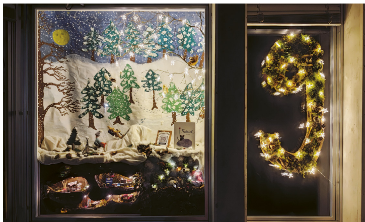
Gemeinschaftsprojekt Adventsfenster – ein gelungener Anlass!