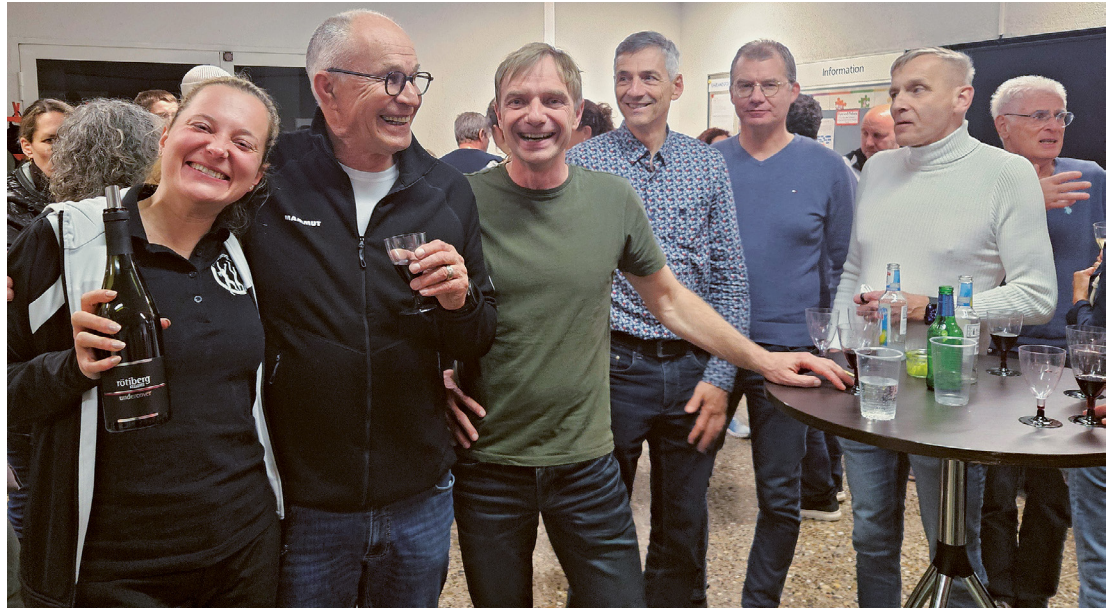
Gemütliches Beisammensein beim Apéro.

Zuerst kam allerdings der offizielle Teil der Generalversammlung. Gemäss Statuten mit Jahresberichten der Jugend, der Erwachsenen und dem Jahresbericht des Präsidenten. Tobias Freitag nahm seinen Bericht zum Anlass für einen Rückblick: Zehn Jahre TSF, zehn Anlässe.