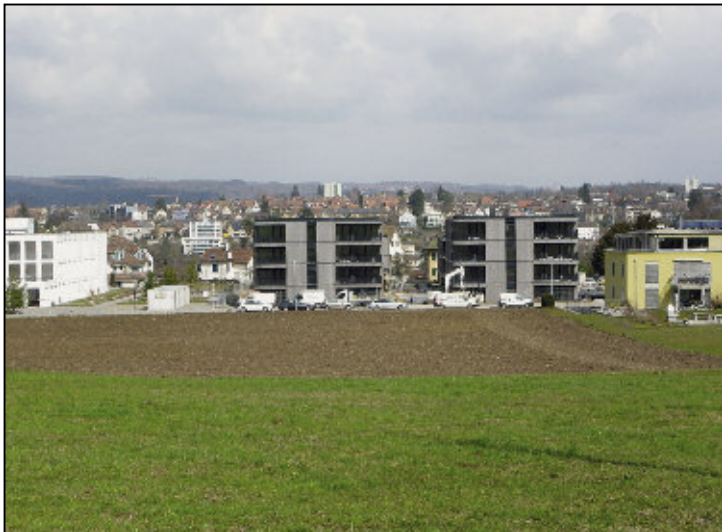
Zwischen dem Zentrum Kohlfirst und dem Wohnheim Marchstei am Rüttenenweg erheben sich die beiden höchsten 4-geschossigen Wohnhäuser. Sie verdecken bei dieser Blickrichtung die dahinterliegenden 3-geschossigen Wohnhäuser. Das fünfte Haus der Gruppe ist durch das Wohnheim Marchstei verdeckt. Im Hintergrund weitet sich das Panorama von Schaffhausen.

Umgebungsgestaltung, mit Wegen, Plätzen und der Begrünung abgeschlossen ist.