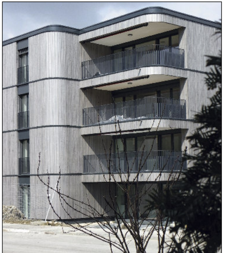
Das farblich behandelte Lärchenholz schimmert bei Sonneneinstrahlung in einen vornehmen Silberglanz, wobei die horizontalen Zäsuren optisch die Wohngeschosse horizontal gliedern.

Jetzt herrscht noch ein emsige Treiben der Bauhandwerker, um den Innenausbau zu tätigen. Das Kleid der Überbauung ist aber erst fertig, wenn die Knöpfe dran sind, d.h. die