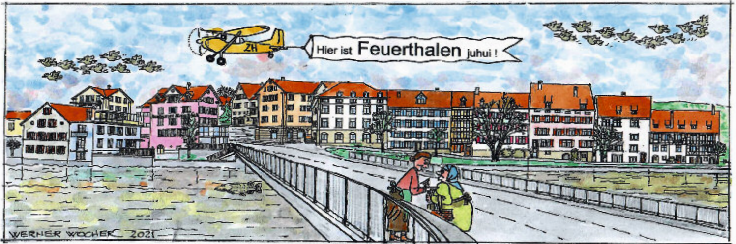
Das Tor zu unserer Gemeinde als Bilderbuch-Panorama, «Füerthale mir g'fallsch».

Die Rheinbrücke Schaffhausen-Feuerthalen, im Volksmund auch Feuerthaler Brücke genannt, verbindet die Stadt Schaffhausen im gleichnamigen Kanton mit der Gemeinde Feuerthalen im Kanton Zürich. Feuerthalen ist auch die nördlichste Gemeinde des Kantons Zürich und vis-à-vis über dem Rhein ist der Kanton Schaffhausen der nördlichste Kanton der Schweiz. Es ist also ein geographisch bedeutender Ort, an dem sich Schaffhausen mit sei-