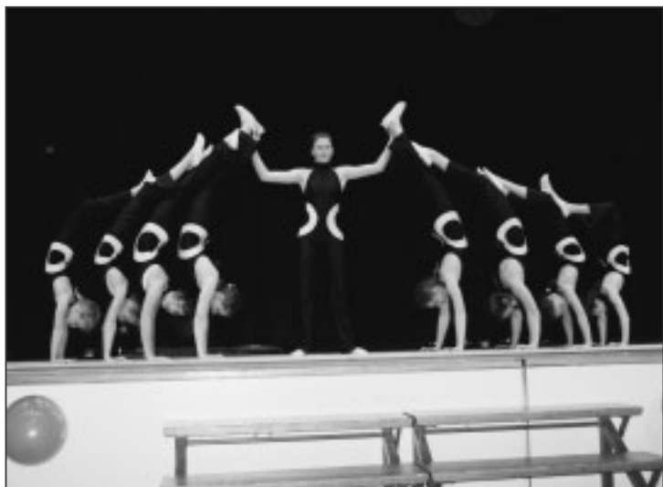
Bodenakrobatik in Perfektion.