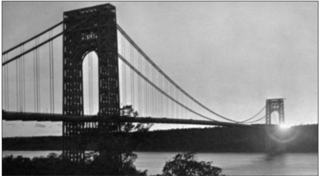
Die George Washington Bridge war von 1931 bis 1937 mit 1067 Metern Spannweite die längste Hängebrücke der Welt.

Imposant sind zum Beispiel einige Daten der Verrazano-Narrows-Brücke, welche die