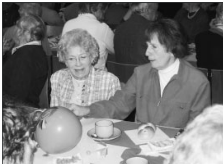
Gemütliches Beisammensein nach dem vielfältigen Zirkusprogramm.