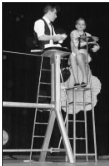
Ein Bistro der besonderen Art.