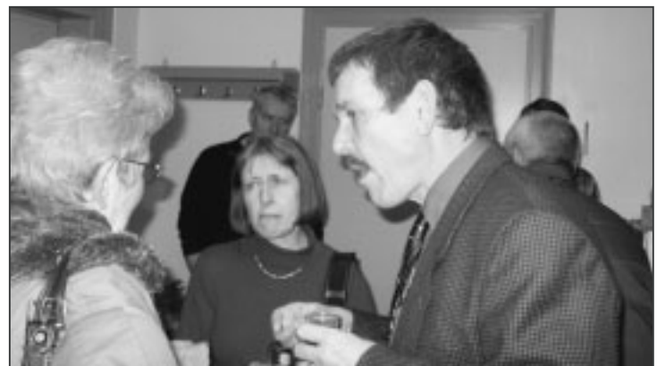
Auch beim Apéro wurden noch Fragen beantwortet.

Wer mehr über Othmar Hermann Ammann und seine Wer-