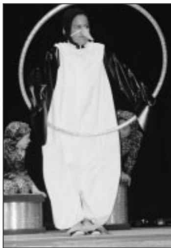
Schnatternd zeigt der Pinguin seine Kunststücke.