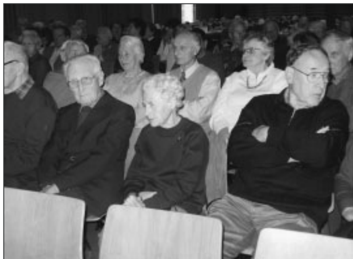
Das Publikum amüsierte sich prächtig.