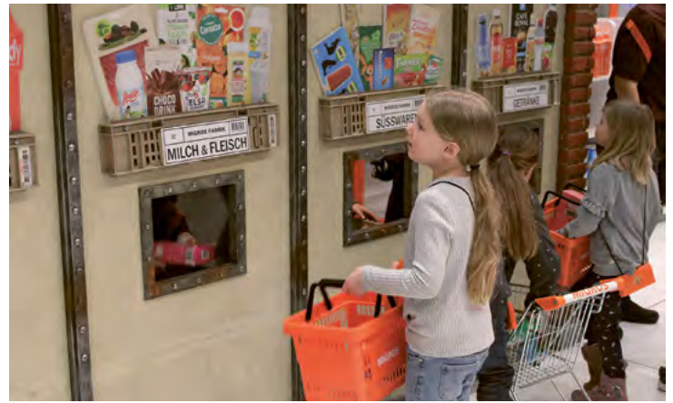
Was gehört wohin? In den verschiedenen Fenstern der «Migros-Fabrik» können die gekauften Waren wieder zurückgegeben werden.

räumen treten 30 fröhliche und zufriedene Kinder aus der Mini-Migros. Super sei es gewesen, betonen alle auf Nachfrage. Auf die Frage, was ihnen am besten gefallen habe, können sie sich allerdings nicht einigen. Viele arbeiteten gerne an der Kasse, andere bevorzugten das Einräumen der Regale, andere nennen einen spektakulären Einkauf, den sie getätigt haben – etwa einen ganzen Einkaufswagen voller Zahnpasta «sicher hundert Tuben!», wie ein Schüler stolz erklärt. Ob die Migros mit ihrer Aktion nun Nachwuchstalente im Bereich Verkauf, Logistik und Mer-