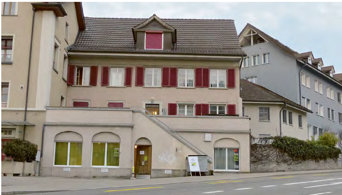
Noch bis Ende Juni sind die Türen des ÄNET am RHY an der Zürcherstrasse geöffnet.