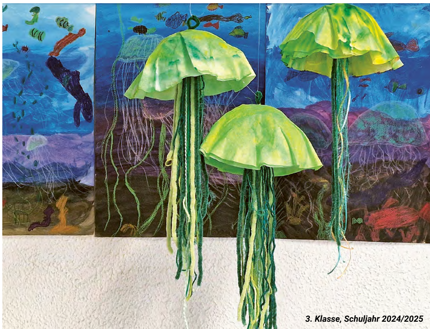
3. Klasse, Schuljahr 2024/2025