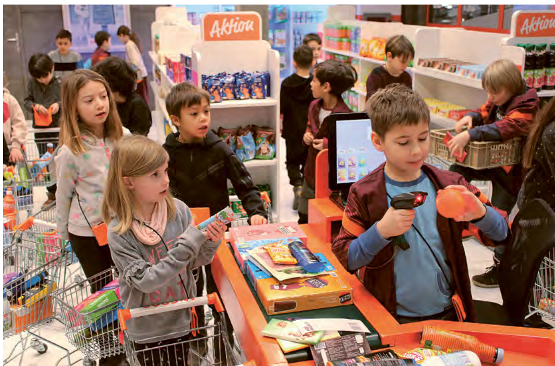
Einscannen, bezahlen, Regale einräumen – Kunden und Verkaufspersonal in voller Action im Mini-Migros.

Im Innern des Mini-Supermarktes warteten Regale mit zahlreichen Migros-Produkten auf die Einkäuferinnen und Einkäufer: von A wie Ananas, über G wie Geschirrspülmittel, bis hin zu Z wie Zahnpasta. Schnell konnten erste Favoriten in den Einkaufswagen festgestellt werden: die