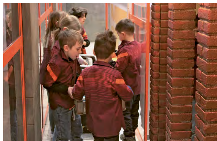
Emsiges Treiben im Lager, damit der Warenbestand immer wieder aufgefüllt wird.

zahlten ihre Einkäufe direkt per Cumulus-Karte, so dass das Spielgeld unangetastet im Portemonnaie verbleiben konnte. Auch unauffälliges «Neben-der-Kasse-Vorbeihuschen» konnte durch die Glasscheiben beob-