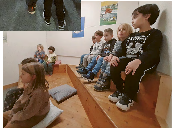
Wir hören eine spannende Geschichte.