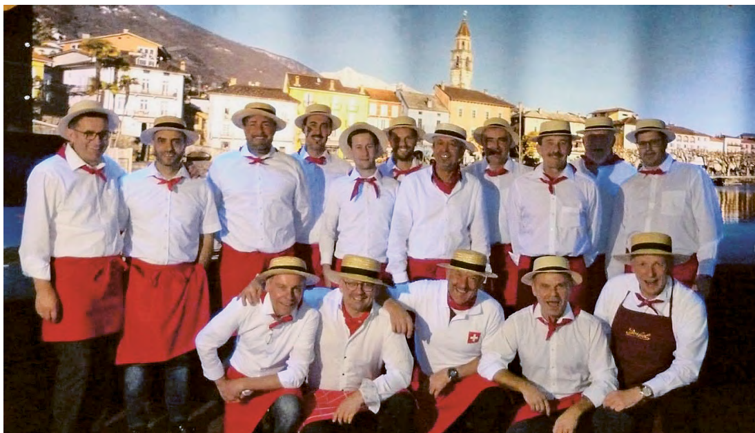
Bei vielen unvergessen – die FCF Señores.