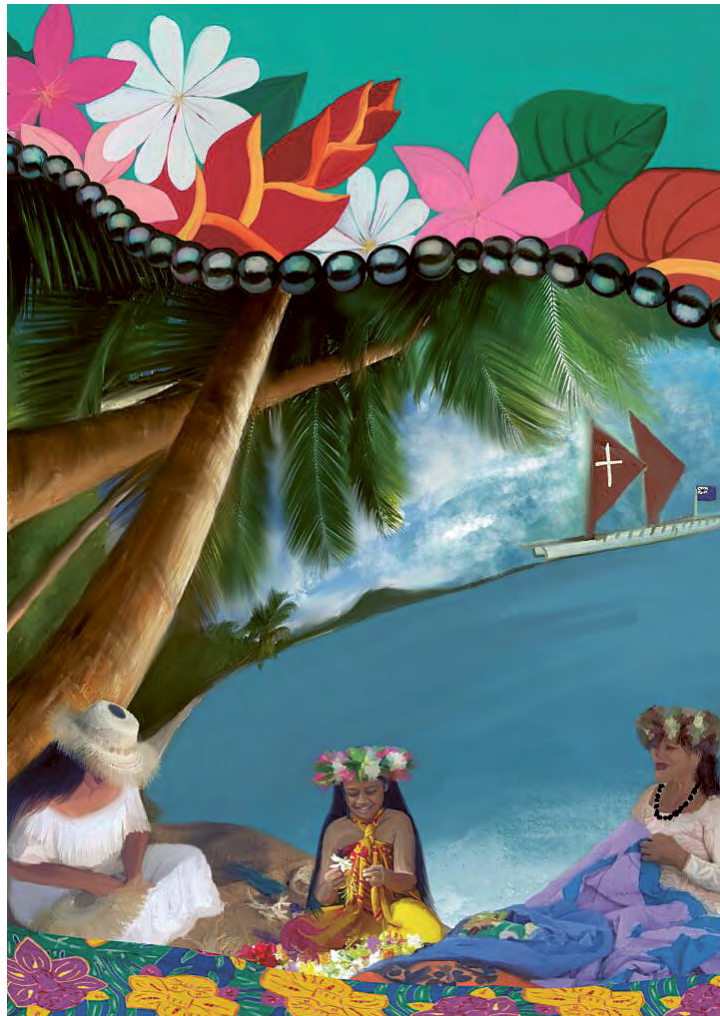
Weltgebetstagsland 2025: Cook Islands.

Die Trinkwasserversorgung ist eine riesige Herausforderung. Grund dafür ist der steigende Meeresspiegel. Wenn das