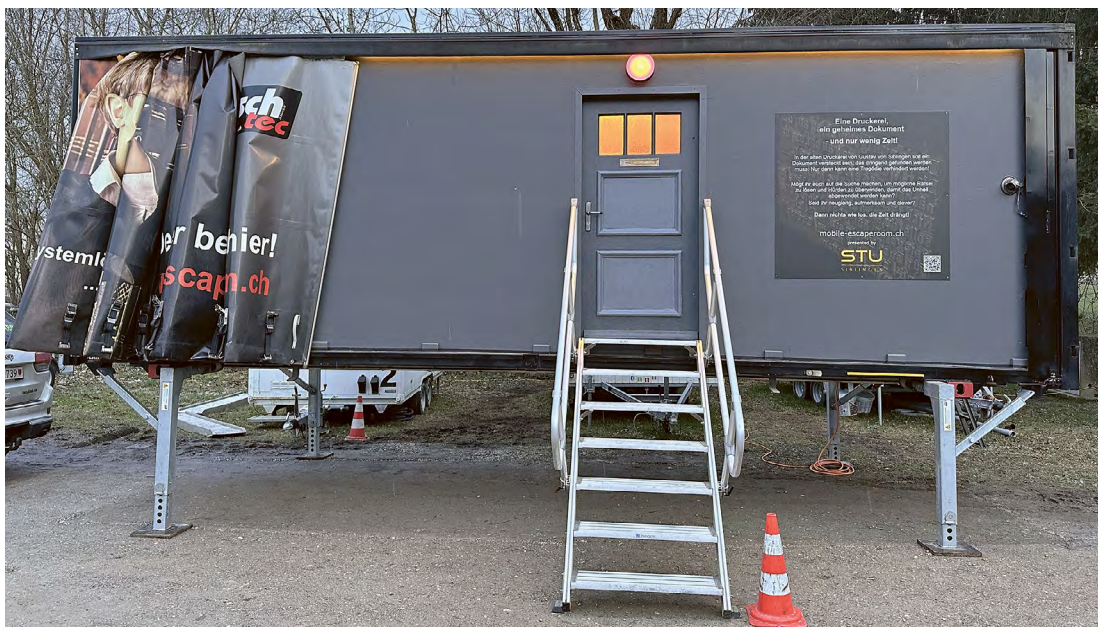
Hinter dieser unscheinbaren Tür wartet eine Reihe kniffliger Rätsel.

Das ist die Prämisse des mobilen Escape Rooms mit dem Namen «Die alte Druckerei», der seit fünf Wochen durch das Zürcher Weinland tourt. Um der Re-