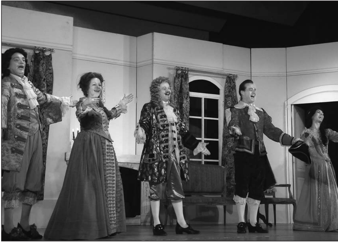
Hurra! Jetzt wird geheiratet.