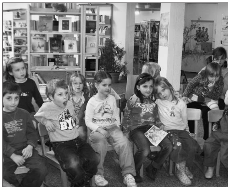
Nach dem Zvieri sind alle satt und zufrieden.