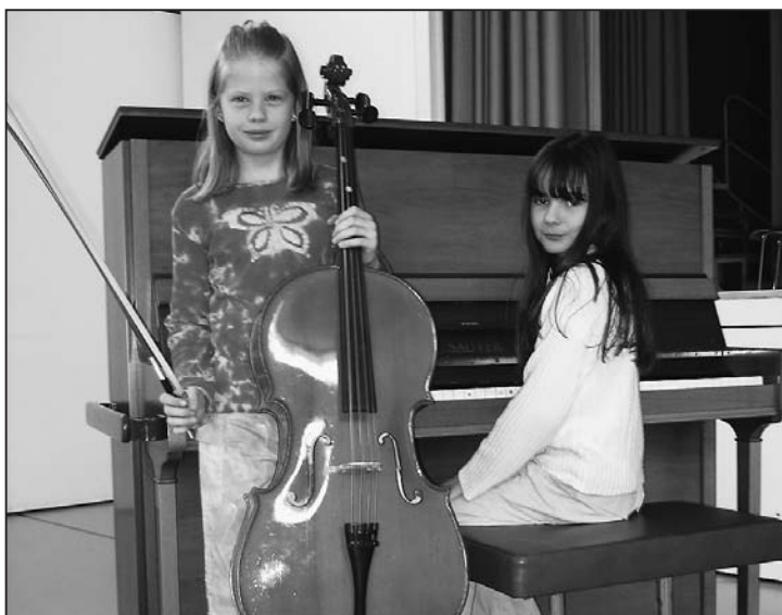
One team – one spirit.