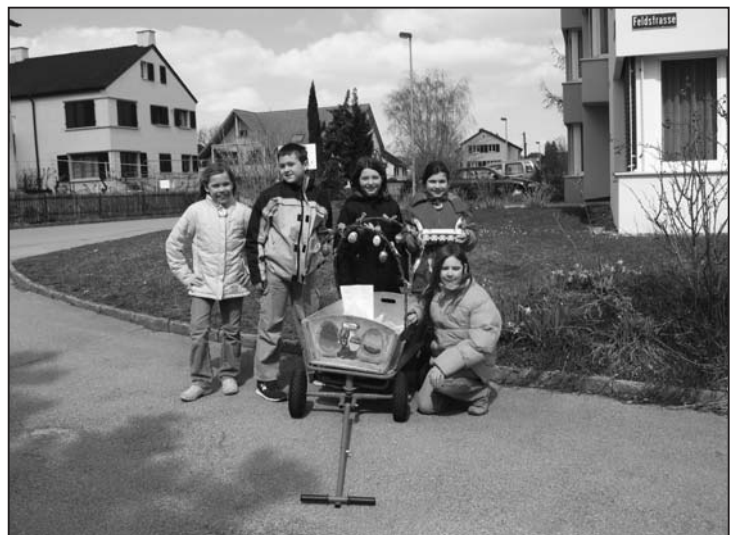
Gut gelaunte Eierverkäuferinnen und Eierverkäufer.