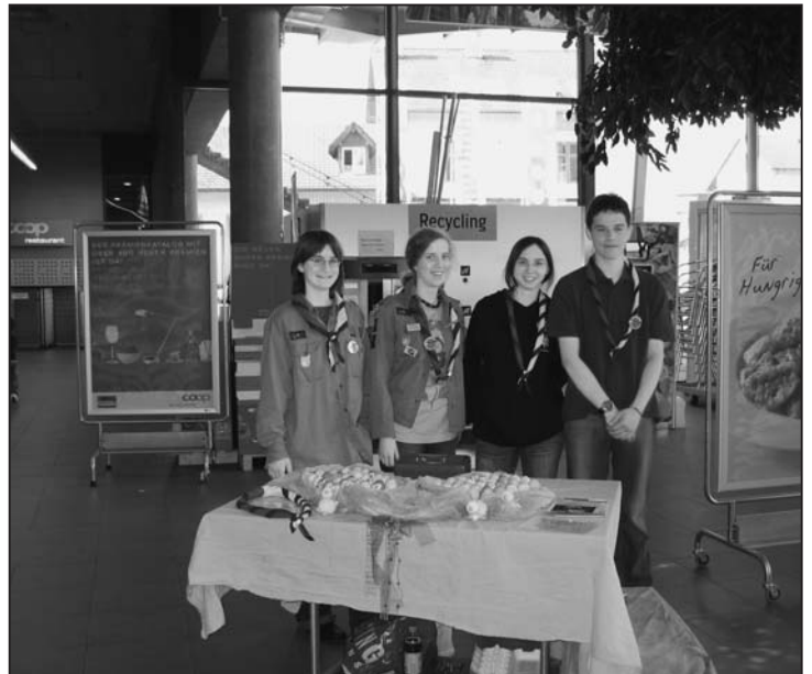
Toller Einsatz der Pfadi im Rhymarkt.