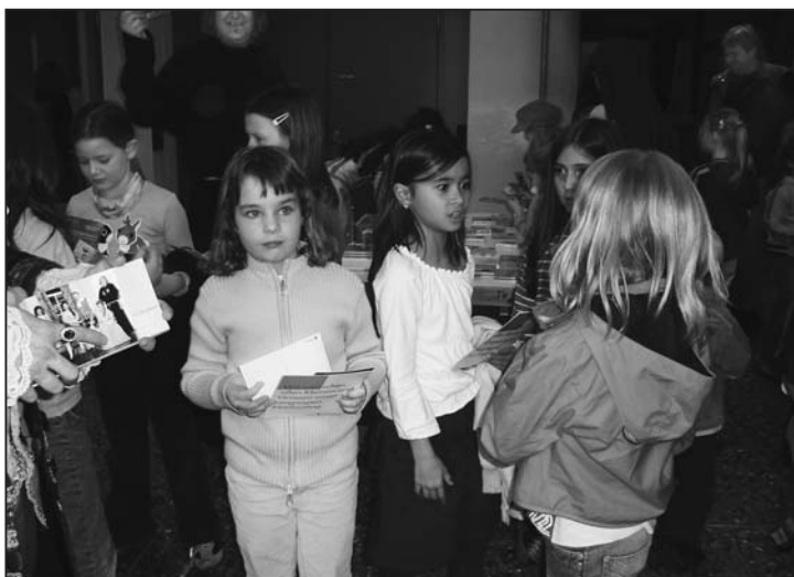
Ein Autogramm für mich.