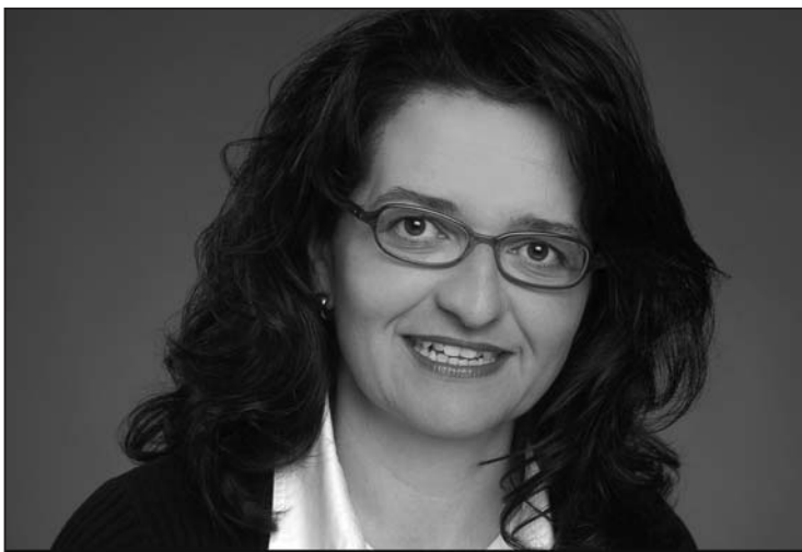
Gemeindewahlen Feuerthalen, 21. Mai 2006