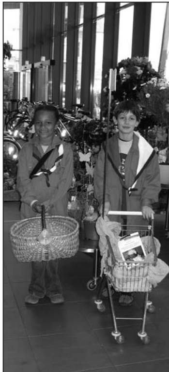
Sind die Körbe nicht schon leer?

Am Samstag von morgens früh bis in den Nachmittag hinein boten die Bienli und Wölfli die restlichen, gefärbten Eier in kleinen Einkaufswagen und Körben den Kunden im Rhymarkt an. Mutig sprachen sie ihre Kundschaft an. Der Einsatz der Kinder wurde belohnt, denn bereits um 14.30 Uhr waren alle Eier verkauft.