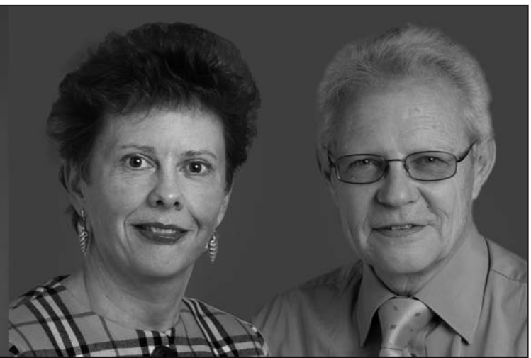
Gemeindewahlen Feuerthalen, 21. Mai 2006

Für ein weiterhin attraktives Feuerthalen!