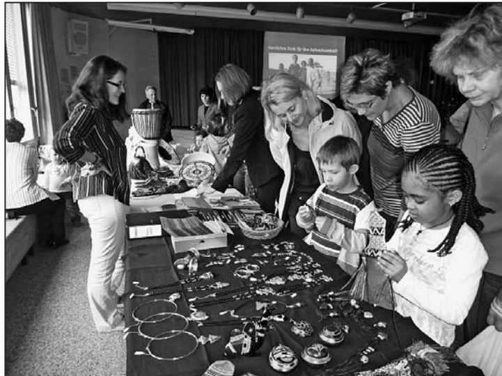
Viel Betrieb am Tuareg-Bazar.