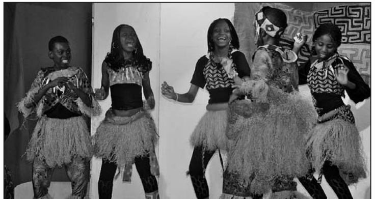
Pulsierende Auftritte mit afrikanischem Flair.

In den letzten Tagen hat die Gruppe unter dem Motto «AFRIKA – Vergangenheit und Zukunft» daran erinnert, dass Afrika nicht nur aus den uns bekannten verarmten Landschaftsbildern oder den leidenden Kindern besteht, sondern aus einer jungen, aufgeweckten Generation, die den Willen hat, Dinge zu verändern.