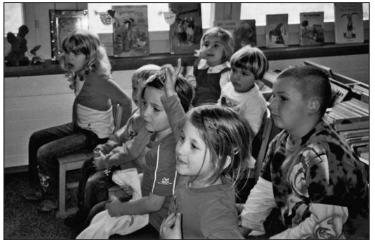
Aufmerksame Zuhörer am Ostergeschichten-Nachmittag.

Vor den Sommerferien luden wir die Erst- bis Drittklässler erstmals zu einer «Sommerlesenacht» in den Wald ein. Das unsichere Wetter hatte zur Folge, dass nicht ganz alle 60 angemeldeten Schülerinnen und Schüler erschienen. Der Abend wurde