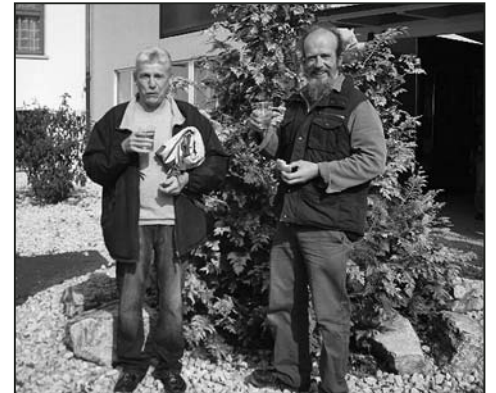
Der «alte» und der «neue» Hauswart.

durch seine Tätigkeit als Hausangestellter im Schulhaus kein Unbekannter ist, hat am 1. April seine neue Arbeit als Hauswart angetreten. Die Schulpflege wünscht beiden Abwarten in ihrem neuen Lebensabschnitt alles Gute.