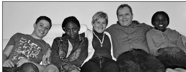
Die Gastfamilie zusammen mit ihren Gästen.