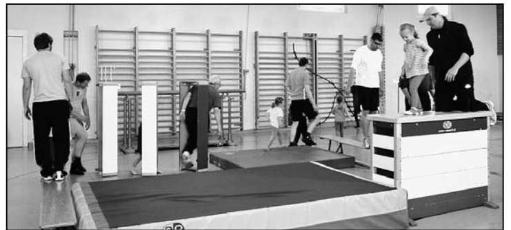
Eine Bahnfahrt mitten in der Turnhalle.

wärmen gab es ein Bähnlifangis. Die Papis waren die Lokomotive mit den Kindern als Passagiere auf den Schultern. Das gab doch schon ziemlich warm... Nachdem die Posten für eine tolle Bahnfahrt aufgestellt waren, gings los. Zuerst in der Mitte eine Runde Bahn fahren (über den Schwedenkasten auf die Matte, durch Kasten-elemente, über den Langbank wieder auf eine Matte), dann durften die Kinder selber entscheiden, wohin die Reise