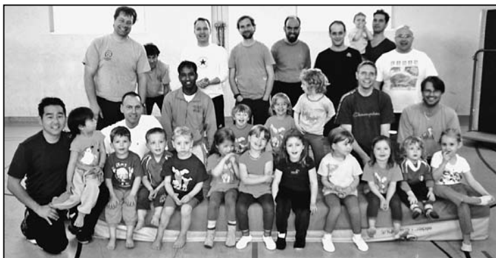
Eine der beiden Papi-Götti-Grosspapi-Gruppen.