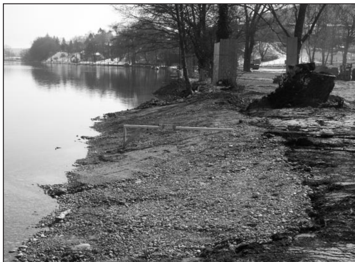
Der erste Abschnitt des Flachufers kurz vor der Fertigstellung.