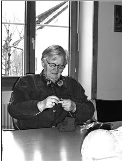
Hier werden die bekannten Finkli produziert.

Für einen guten Zweck kommen die Frauen des Arbeitskreises jeweils jeden zweiten Dienstag im Schulhaus Spilbrett zusammen. Doch wie überall, wo Frondienst geleistet wird, fehlt es auch in diesem Kreis an Zuwachs.