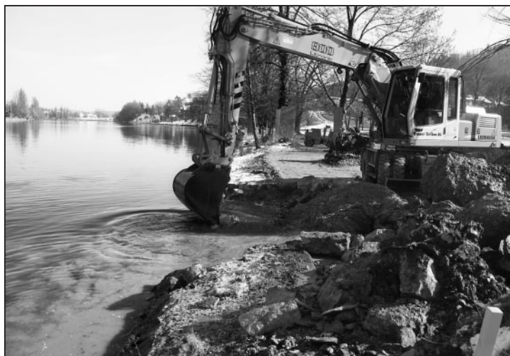
Abbruch und Verlad des alten Steinsatzes.