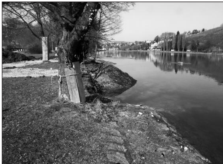
Beginn der Bauarbeiten – Im Vordergrund ist noch der alte Steinsatz sichtbar.