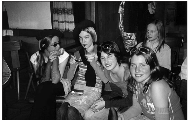
Zuschauer bei der Abendunterhaltung.

Das Haus war eine «verlorterte» Villa!!! Es gab Zweier-, Dreier- und Viererzimmer. In der Nacht war nicht in jedem Zimmer um 22.00 Uhr Nachtruhe, sondern um 23.00 Uhr oder sogar um 00.00 Uhr! Im Lager waren 38 Kinder, zwei Köche, sieben Skilehrer und