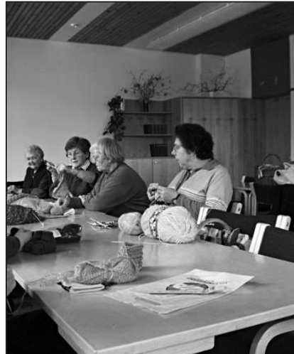
«Wie geht jetzt das schon wieder?»

auch Pullover auf Bestellung oder angefangene Pullover fertig. Auf die Frage, ob das Stricken heute nicht ein ziemlich teures Unterfangen sei, zeigten sie mir einen grossen Kasten mit Spendenwolle. Immer mal wieder kommt es vor, dass ein grosser Sack voll Restenwolle vor der Türe steht. Also, liebe Feuerthalerinnen und Feuerthaler, die Wolle nicht wegwerfen oder horten, sondern für einen guten Zweck spenden.