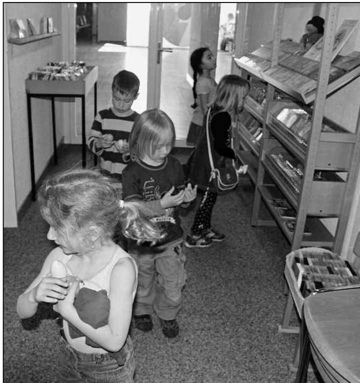
Ostereiersuche in der Bibliothek während der Ostergeschichte.

Neue Teammitglieder haben auch neue Ideen, und so kam es, dass neben den bisherigen Anlässen wie Autorenlesung für die Schüler, Ostergeschichte für die Kindergartenkinder und Buchstart auch einige neue dazu kamen. Klasseneinführungen veranstalteten wir vom 2. Kindergarten bis zur 6. Klasse. Altersgerecht und auf eine spielerische Art und Weise lernten die Kinder die verschiede-