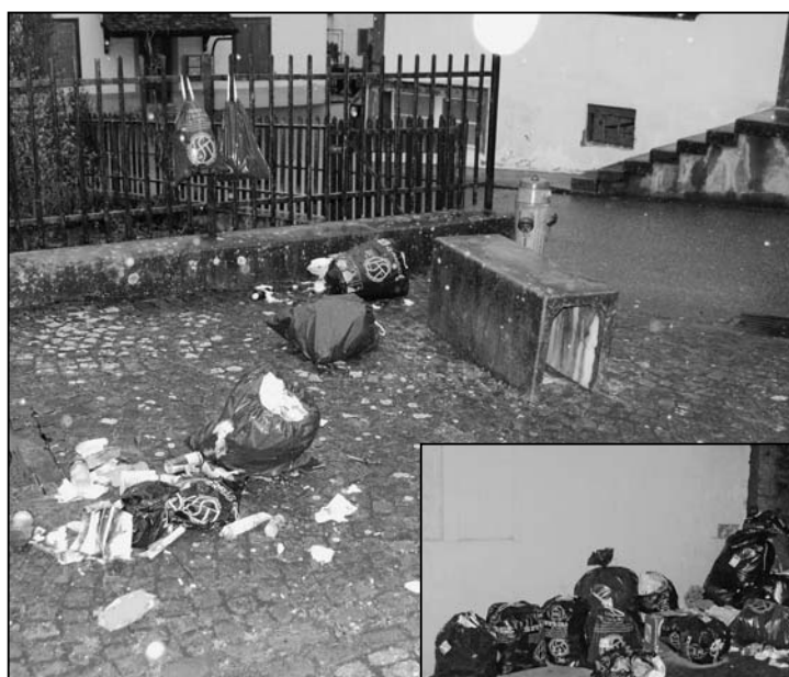
Unappetitliche Abfallentsorgung an der Adlergasse.

das kommt wohl niemandem ernsthaft in den Sinn. Würden die Abfallsäcke, wie in Artikel 21 Absatz 5 der Abfallverordnung der Gemeinde Feuerthalen vorgeschrieben, erst am Abfuhrtag bereitgestellt, würde sich dieses Problem grösstenteils selber erledigen. Noch besser wäre es natürlich, wenn sich alle Hausbesitzer dazu durchringen könnten, zu ihren Liegenschaften Abfallcontainer anzuschaffen. Dazu fehlt jedoch vielerorts, insbesondere an den genannten Orten, offensichtlich der Wille. Eine gesetzliche Grundlage für ein Containerobligatorium bei allen Liegenschaften gibt es gemäss Gemeindeschreiber ad interim Ernst Ruosch allerdings nicht: «Für neue Überbauungen wird dies in der Baubewilligung geregelt, bei bestehenden Liegenschaften bleibt uns jedoch nichts anderes übrig, als die Leute immer wieder auf das Problem aufmerksam zu machen. Auch im Abfallkalender