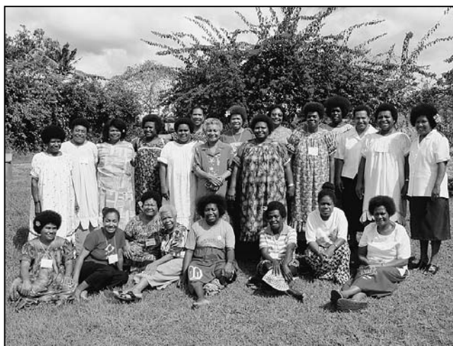
Das Bild zeigt Vertreterinnen des Weltgebetstags-Komitees. Sie verfügen nicht über einen eigenen Telefon- und E-Mail-Anschluss.

Die Kolonialherren brachten Ende des 19. Jahrhunderts die kapitalistische Marktwirtschaft und westliche Ideologien ins Land und kommunizierten mit den Anführern der einzelnen Stämme. Die männliche Bevölkerung gewann an Macht, während die Frauen von dieser neuen Modernisierung ausgeschlossen wurden. Die Clans investierten in ihre Söhne und schickten sie auf die Schulen, während die Töchter zu Hause zu Ehefrauen erzogen wurden. Bis heute sind 60 Prozent der