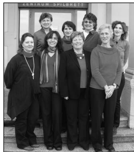
Die diesjährige Gruppe des Weltgebetstages, alle mit einer guten Ausbildung, Telefon- und E-Mail-Anschluss.

Wir vom Weltgebetstag haben die Möglichkeit, uns mit diesen Frauen zu solidarisieren, der Öffentlichkeit von ihrer Lebensweise zu berichten, aber auch auf ihre sozialen Probleme aufmerksam zu machen. Ebenso können wir die verschiedenen Projekte unterstützen, die von kirchlichen Organisationen gefördert werden. Wir Frauen vom Weltgebetstag von Feuerthalen haben uns entschlossen, ganz besonders die