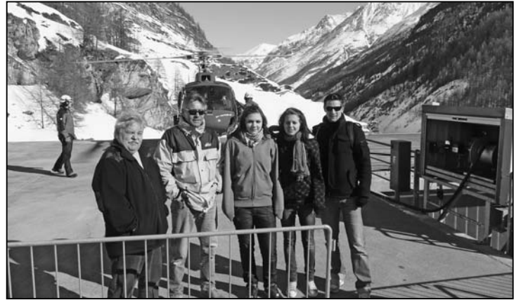
Vor dem grossen Abenteuer.