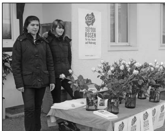
...und Firmlinge beim Rosenverkauf.