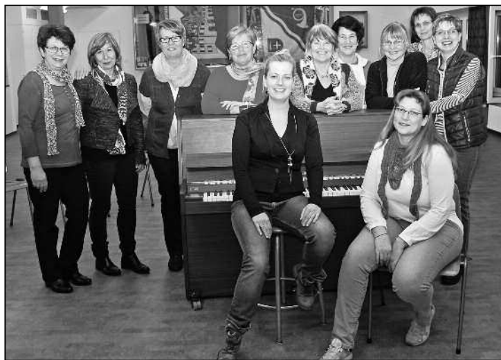
Wer grosse Ziele anstrebt, probt auch, wenn in der Ferien- und Grippezeit nicht weniger als acht Sängerinnen fehlen.

Mittlerweile singen im Frauenchor ChorIversum Frauen (fast) jeden Alters, auch aus anderen Gemeinden und von ennet der Kantongrenze. Ohne sie hätte der Chor eindeutig zu wenig Stimmen, um erfolgreich weiterbestehen zu können. Geprüft wird jeden Donnerstagabend im zweiten Stock des Feuerwehrgebäudes, und man freut sich über jede Stimme, die dazukommt. Besondere Freude hätte der