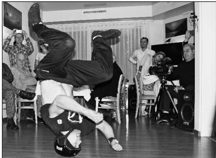
Beim Headspin ist der Helm sehr empfehlenswert.