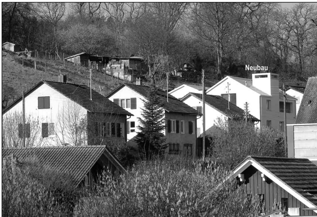
So präsentiert sich die lockere Häusergruppe mit Giebeldächern in der Rüti, umgeben von reizvoller Landschaft.

Letztes Jahr wurde in eine Baulücke der vorhandenen zusammenhängenden Häusergruppe in der Rüti ein Neubau mit Doppelgiebel hinzugefügt. Bei frühlingshaftem Wetter, wenn auch noch im kalendarischen Winter, herrscht schon eine rege Tätigkeit auf den Baustellen. So wurden am Wohnhausneubau im Februar die Fassaden gestrichen und danach die Gerüste demonitiert. Bei strahlendem Sonnenschein präsentiert sich nun die Häusergruppierung, am Fusse des Kohlfirns, mit ihren Dachgiebeln als gelockertes Ensemble. Ein Haus mit Giebeldach, oder auch Satteldach genannt, ist die Urform menschlicher Behausungen. Gerade in unseren Gemeinden ist diese Dachform hauptsächlich vertreten. Bemerkenswert