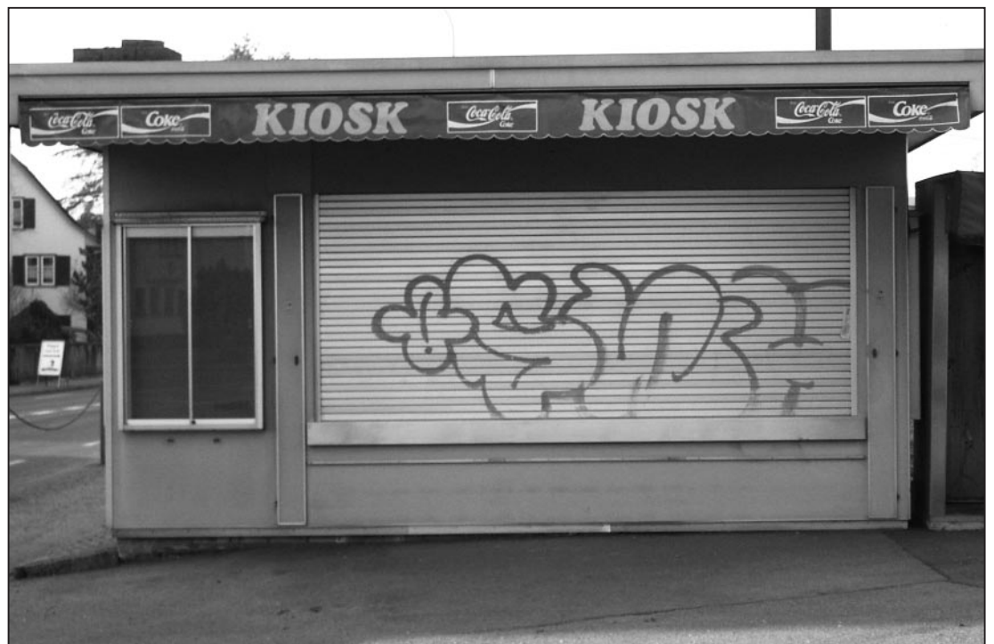
Ohne Zeitungsständer und Verkäuferin eine triste Erscheinung: Feuerthaler Bahnhofskiosk.