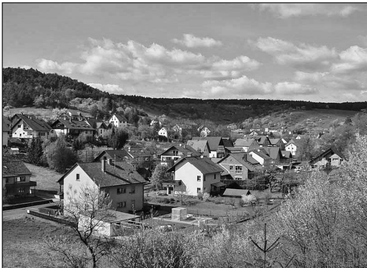
Das beschauliche Feuerthal lädt zum Verweilen ein.