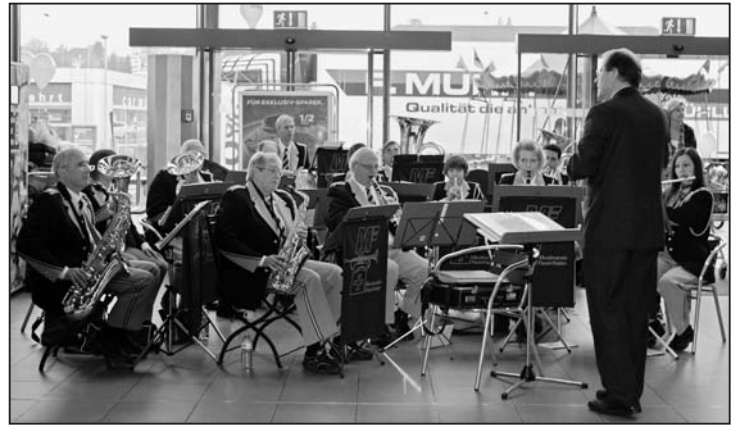
Der Musikverein Feuerthalen bei einem Konzert im Coop in Feuerthalen.

Die Vorbereitungen auf unsere grosse musikalische Reise laufen auf Hochtouren. Die Tickets sind reserviert, die Koffer sind gepackt, jetzt steht unserer gemeinsamen Reise nichts mehr im Wege. Um dem grauen Flachlandwinter zu entkommen, lädt Sie der Musikverein Feuerthalen am 19. Februar zu einer musikalischen Reise ein. Wir werden um die ganze Welt