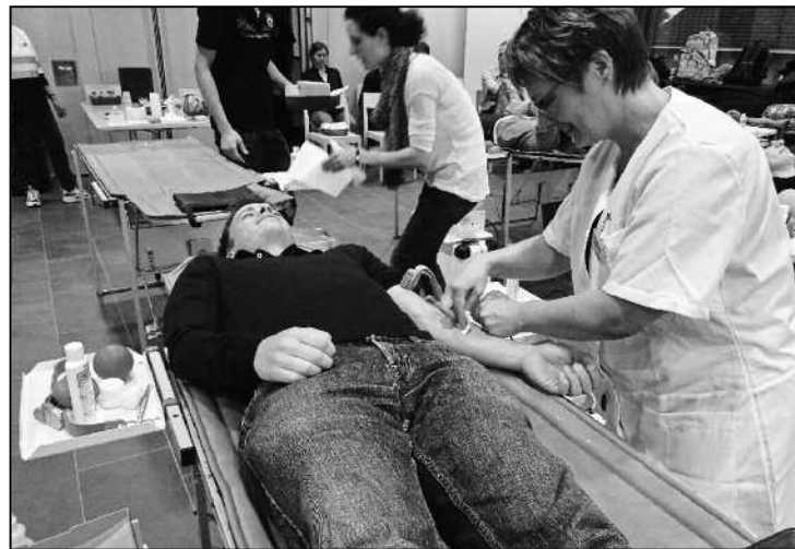
Bequem liegen und dabei Gutes tun – das ist Blutspenden.

Der Samariterverein Feuerthalen-Langwiesen