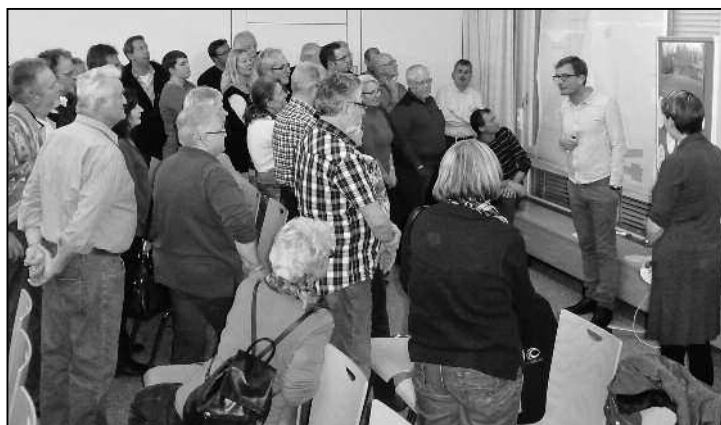
In Gruppen wurde diskutiert, gefragt und kritisiert.

In drei Etappen, jeweils über Winter, sollen die Arbeiten ausgeführt werden, so der Zeitplan. Demnach wäre die ganze Freizeitanlage im Mai 2018 fertig. Eben diese Etappierung gab ebenfalls zu reden. Ob es schlussendlich tatsächlich drei Bauetappen braucht, oder ob