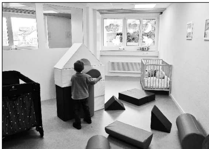
Die Wände sind zwar noch ein wenig blass, doch scheint das den kleinen Jungen in seiner Kreativität nicht zu stören.