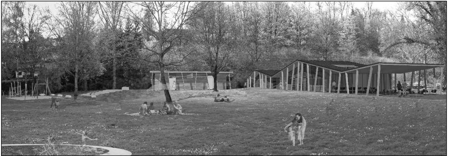
Das Hauptgebäude mit Reception, Restaurant und Wohnung fügt sich gut in die Anlage ein.

Was hat der Gemeinderat mit der Freizeitanlage Rheinwiese für Pläne? Soll es ein Luxus-Projekt werden oder plant man realistisch? Warum wird in Etappen realisiert und nicht alles auf einmal? Kann sich unsere Gemeinde die Anlage leisten, und was soll das Ganze überhaupt kosten? Fragen zum Projekt gibt es viele – einige davon konnte der Gemeinderat an der Infoveranstaltung vom letzten Dienstag beantworten.