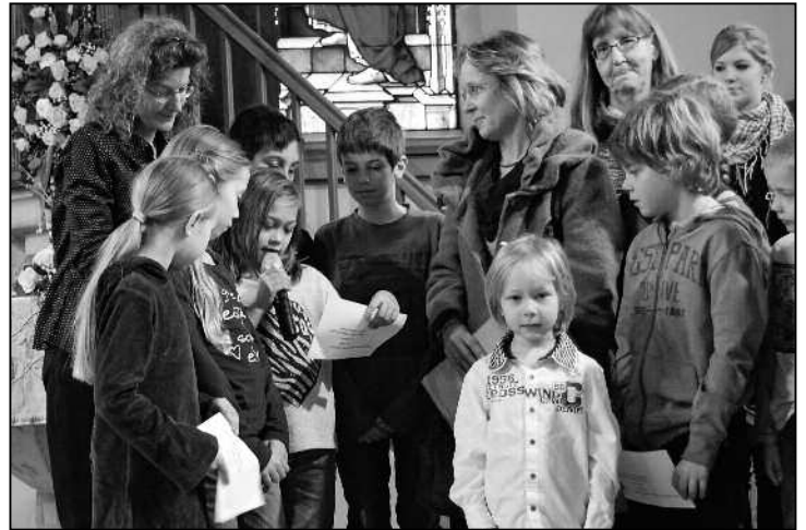
«Wir wünschen uns lustige Begegnungen mit euch», die Domino- und Kolibri-Kinder haben ihre eigenen Vorstellungen.