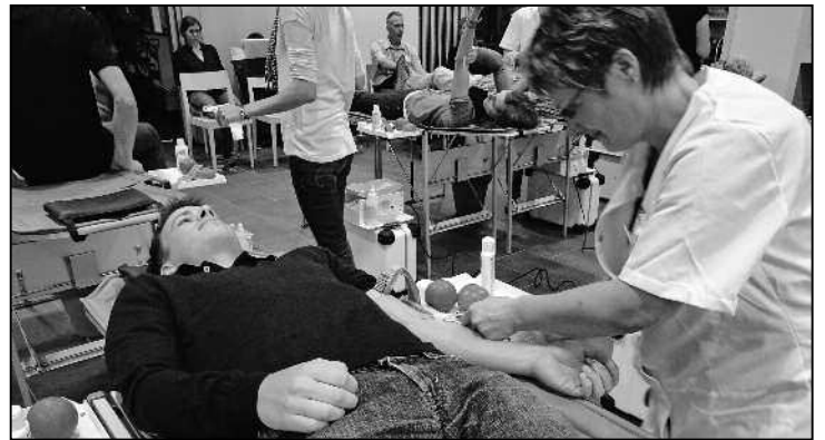
Wo sonst kann man so entspannt Leben retten wie beim Blutspenden?

Vielleicht braucht es ein wenig Überwindung, aber es ist doch ein gutes Gefühl, zu helfen. Möglicherweise retten Sie mit Ihrer Spende jemandem sogar das Leben, oder vielleicht brauchen auch Sie einmal gespendetes Blut! Nach einem Gesundheitscheck und einem kurzen Gespräch mit einem Arzt erwarten Sie professionelle, freundliche Pflegefachfrauen, und schon nach kurzer Zeit haben Sie das eigentliche Spenden hinter sich! Anschliessend können Sie entspannt die liebevoll zubereitete Verpflegung geniessen. Übrigens dürfen alle im Alter von 18 bis 75 Jahren