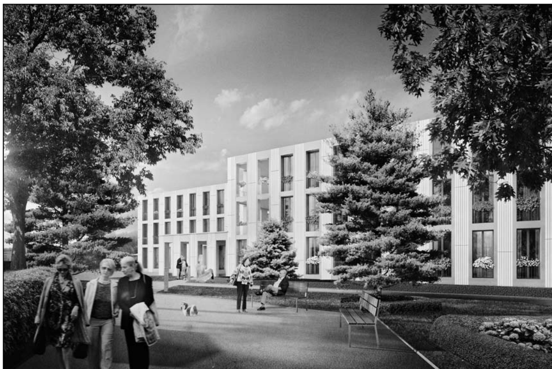
Ein Haus mit Emotionen: Ostansicht des neuen Zentrums Kohlfirst.

Das Ergebnis dieser «schönen und konstruktiven Zusammenarbeit», wie Rohrbach bekräftigte, ist ein Projekt, das fast 30 Millionen Franken kosten soll und das, so die Planung, Mitte 2014 realisiert sein wird. Das Zentrum Kohlfirst wird 75 Zimmer auf drei Etagen umfassen, 15 dieser Zimmer werden in der Abteilung für Demenzpatienten im Erdgeschoss sein. Das Zentrum Kohlfirst wird zudem eine Cafeteria, Räume für Spitex und Arzt, Physiotherapie und Fitness, Coiffure und Podologie und einen «Raum der Stille» umfassen. Küche, Wäscherei, Technikräume und eine Tiefgarage mit 25 Plätzen sind im Untergeschoss vorgesehen. Nach der Realisierung des Neubaus soll das bestehende Alters- und Pflegeheim abgebrochen und das frei werdende Bauland im Rahmen des ebenfalls beantragten Landabtauschs der Gemeinde Feuerthalen, welche ihrerseits die Bau-