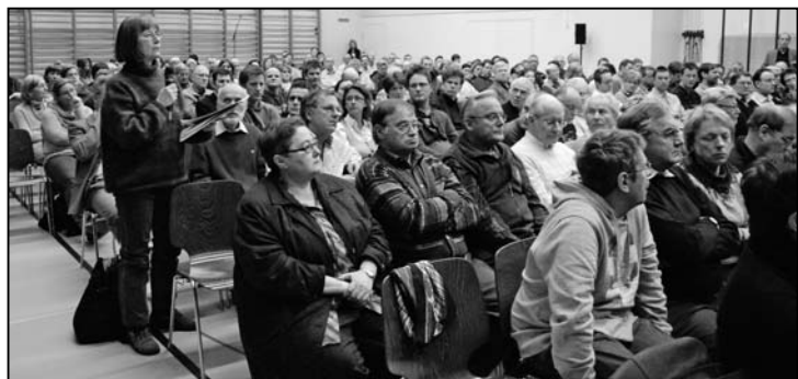
Eine vollbesetzte Halle und engagierte Voten prägten den Abend.

Die nächste regionale Informationsveranstaltung findet am 8. Februar 2012 um 19.30 Uhr im Gemeindehaus Schlatt TG statt.