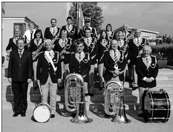
Der Musikverein Feuerthalen noch im alten Outfit.

Also lassen Sie sich diese einmalige Gelegenheit nicht entgehen und erleben Sie hautnah die Verwandlung des Musikverein Feuerthalen mit. Damit das Warten nicht zur Qual wird, werden Sie natürlich bestens aus unserer Küche verpflegt. Unser Küchenchef empfiehlt Ihnen «Geschnitztes mit Teigwaren und Gemüse», dazu heimischen Wein, Kuchen und Torten zum Dessert und zur Krönung einen Musikerkaffee.