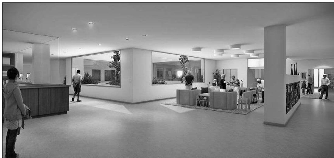
Auch der Eintritts- und Empfangsbereich präsentiert sich einladend und lichtdurchflutet.