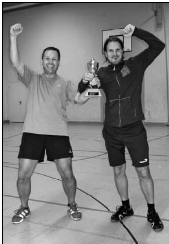
So sehen Sieger aus ...

Der Wanderpokal des Turnvereins hat seit 1998 endlich wieder einmal eine «Wanderung» gemacht. Nach dem erfolgreichen Auftakt des Vereinswettkampfes 2010 stand der zweiten Ausführung nichts im Wege. Trotz der Vorweihnachtszeit kamen erneut zwanzig Aktive, um am Dienstagabend, dem 13. Dezember 2011 beim Plauschvereinswettkampf mitzumachen. Nachdem die