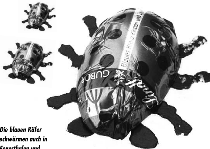
Die blauen Käfer schwärmen auch in Feuerthalen und Langwiesen wieder aus.

Mit «roundabout» bietet das Blaue Kreuz Mädchen und jungen Frauen zwischen 12 und 20