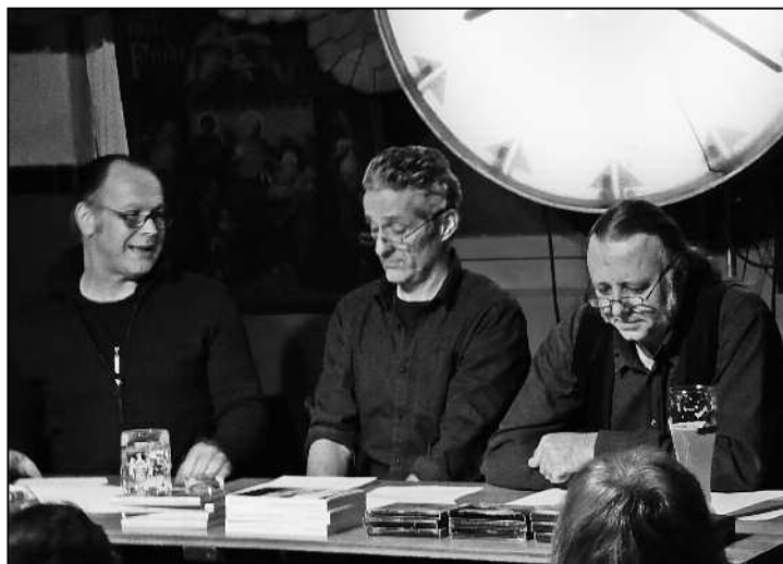
Mit einer grossen Portion Leidenschaft für den Text und die Ironie trugen die drei Herren des Trios «Donogood» ihre Texte vor und sorgten für gute Unterhaltung.