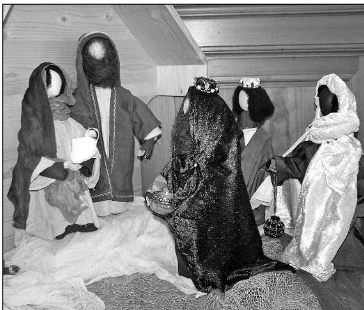
Die Weihnatskrippe mit den Königsfiguren wurde von Feuerthaler Schülerinnen und Schülern gestaltet.

Früher war das anders, nicht ganz so subtil, sondern einfacher: Ein König war ein Herrscher, und genau darin bestand seine Macht. Natürlich wurde auch über ihn geredet, aber er hatte das Sagen und traf alle wichtigen Entscheidungen. Er brauchte keinen zu fragen, wenn er etwas entscheiden wollte oder unternahm. Seine Macht war absolut und damit je nach Erfolg tatsächlich auch weltbewegend und weltverändernd, im politischen Sinne eben und notfalls auch mit Gewalt.