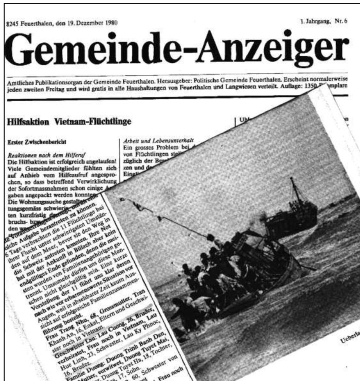
Vor genau 35 Jahren berichtete der Gemeinde-Anzeiger über die Hilfsaktion in unserer Gemeinde.

Mitte Januar 1981 schliesslich konnte die Gruppe in der Gemeinde Feuerthalen die bereitgestellten Wohnungen beziehen. Die Leute wurden in der