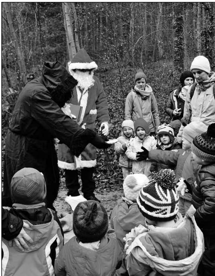
Schmutzli verteilt Grittibänze.

Auch hier machte die momentan grassierende Magen-Darm-Grippe jedoch keinen Halt, so waren es 32 Kinder, die sehr gut angezogen und gespannt darauf warteten, dass es losgeht. Mit einem alten Leiterwagen voll Heisswasser, Punsch usw. zogen wir los Richtung Forstwart-Hütte, bekannter unter dem Namen «Samichlaushütte». Als Alle angekommen waren, begann die Suche nach dem Samichlaus. Das anfänglich zögerliche Klopfen an der Tür und am Fensterladen wurde nicht erwidert. So riefen wir halt laut: «Samichlaus, wo bisch du?» Der Samichlaus hörte uns und kam schon bald den Waldweg entlang geschlurft. Noch etwas gebückter ging der Schmutzli neben ihm her, was wohl am schweren Sack lag, den er dabei hatte. Einige Kinder kamen nun ganz gespannt näher, andere verzogen sich in den «Hintergrund». Der Samichlaus begrüßte uns freundlich und wollte gleich wissen, warum wir MuKi-Turnen heissen, wo doch auch immer Papis und Grosis in der Turnhalle waren, wenn er reingeschaut hat. Also taufen wir unser MuKi-Turnen nun of-