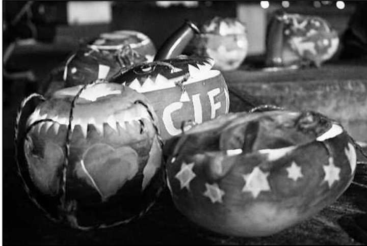
Die schön geschnitzten Räben.

Während das Räbenschnitzen und das gegenseitige Bewundern der kleinen Kunstwerke schon Spass machte, durften sich die Kinder dann nach 17.00 Uhr endlich auf den Weg zur Schule machen. In Gruppen bei der jeweiligen Lehrerin versammelt, ging es mit dem Umzug los. Warm eingepackt und mit sichtlichem Stolz wurden die Räbeliechtli getragen und mit passenden Liedern durch die Strassen begleitet. Die vielen Lichter machten sogar für einen Moment den Sternen Konkurrenz. Im Altersheim angekommen, durften sich die Bewohner über ein kleines Privatkonzert freuen. Jedes Kind bekam noch ein Schöggeli mit auf den Weg, womit es sich gestärkt bestens in Richtung Wald weiterlaufen liess. Inzwischen wurde der Schulhofplatz wunderbar dekoriert mit den von den Unterstufenschülern selbstgebastelten Novemberlichtern. Zudem warteten auch die feine Suppe sowie ein grosses Kuchenbuffet auf die hungrigen Räbenträger und die Besucher. Bevor es aber zur Suppe ging,