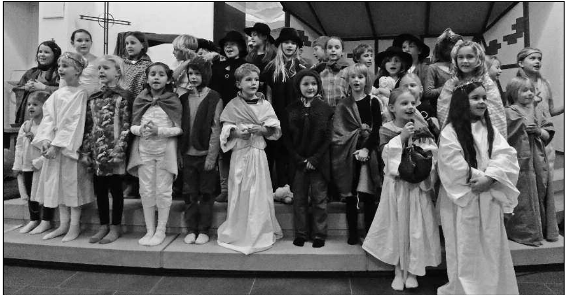
Die Kinder der kirchlichen Kindergruppen «Kolibri» und «Domino» boten ein originelles und eindrückliches Krippenspiel mit vielen Liedern und musikalischen Zwischeneinlagen.

Das Stück handelt von einem Imbissbesitzer namens Big Benjamin und seinem Lehrling Benjamin, die in der Nähe von Bethlehem einen kleinen Imbiss betreiben. Die Geschäfte wollen nicht so recht anlaufen, bis eines Tages ein paar römi-