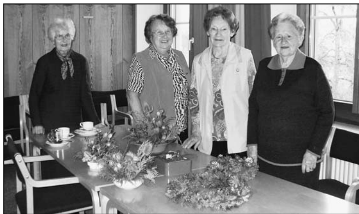
Geübte Hände zaubern wahre Kunstwerke.

Viele Frauen sind allein stehend und freuen sich immer sehr auf die gesellige Runde, die dieser Nachmittag bietet. Das lenkt natürlich auch von den Sorgen und Schmerzen ab. So wird nicht nur in der gemeinsamen Runde im Spilbrett gearbeitet, sondern das Begon-