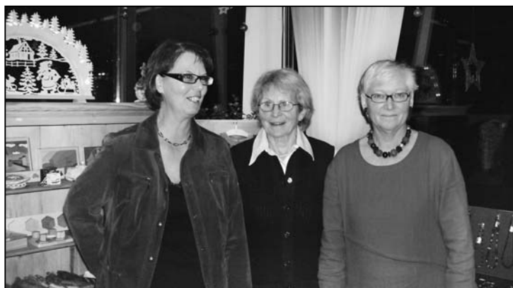
Die drei Ausstellerinnen.