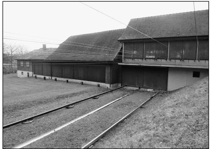
Die Schiesspflichtigen unserer Gemeinde können das «Obligatorische» weiterhin in der Schiessanlage «Chüels Tal» absolvieren. Entschädigt wird nun aber pauschal.

Für die per 1. Januar 2019 kantonweit vorgeschriebene Einführung der neuen Rechnungslegungsvorschriften nach HRM2 (Harmonisiertes Rechnungsmodell 2) müssen im kommenden Jahr die Grundla-