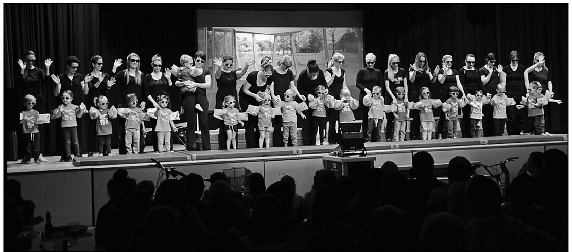
Der Nachwuchs von übermorgen: Die herzigen Muki-Kinder mit ihren Müttern.