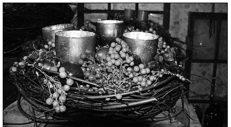
Weihnachtlich rotes Gesteck mit Kerzenlicht.