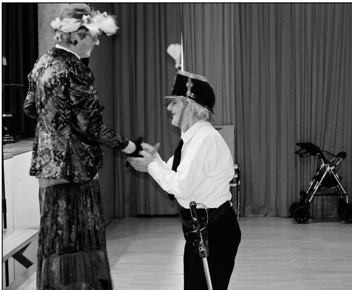
Der kleine Gardeoffizier (eine rüstige Frau vom Chörli) küsst die Hand der gnädigen Frau. Der Rollator rechts im Hintergrund gehörte aber nicht diesem.