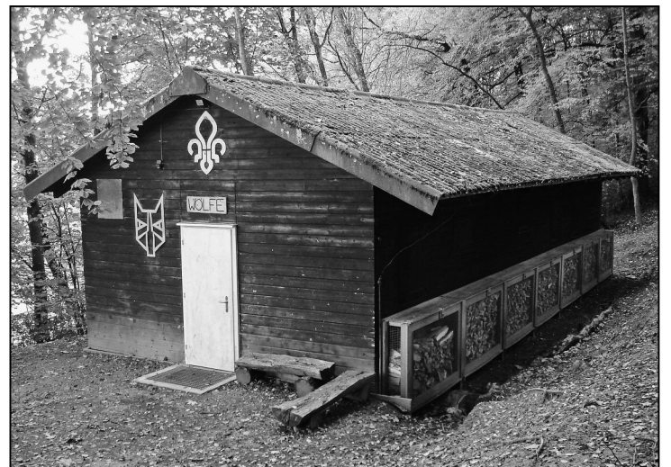
Die Hütte steht seit über 50 Jahren am Waldrand, nun soll sie erneuert werden.

Eltern unverstanden, hauten die Beiden ab. Wir gaben unser Bestes die Lage wieder unter Kontrolle zu bringen. So versuchten wir mit allerhand wie Theater, Pfadiliedern, ... die Eltern zu beruhigen und in langen Suchaktionen (Tageswanderung) klapperten wir die Gegend nach ihnen ab. Wir bewiesen sogar unseren Mut auf einer Monstertrotti-Tour. Gegen Ende der Woche gelang es uns endlich, den Vater von Ronja zu überzeugen, dass sich die beiden Räuberbanden zusammenschliessen und somit Ronja mit Birk (der Sohn des feindlichen Räuberhauptmannes) gemein-