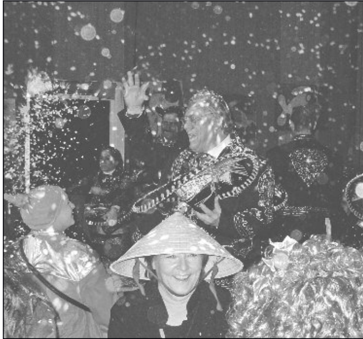
Super Stimmung am «Weisch no...?»-Ball 2016.

Seit dem Hilari 2016 ist schon fast wieder ein Jahr vergangen. Der 13. Januar steht wieder vor der Tür und wir als Vorstand des Hilarivereins Feuerthalen haben in der Zwischenzeit den letzten Hilari analysiert. Die Hilarifete am Samstagabend stand dabei im Fokus. Nach den unglücklichen Ereignissen im letzten Jahr soll und muss sich unserer Ansicht nach eine Veränderung zeigen. Neues Raum-, Sicherheits- und Unterhaltungskonzept: Wir möchten erreichen, dass wieder vermehrt echte Hilarifans die Halle aufsuchen. Dafür wollen wir wieder mehr Sitzgelegenheiten anbieten, welche nicht in der dunklen Nische sondern mitten drin sind. Es wird ein Vorverkauf eingeführt, dadurch wol-