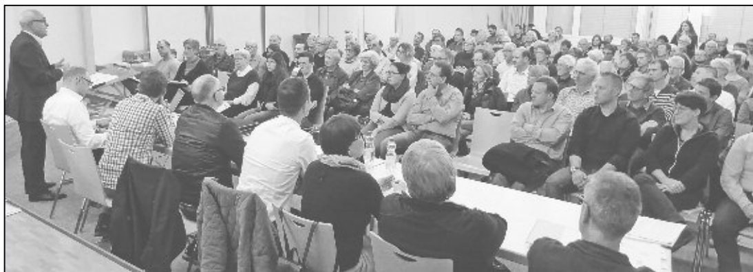
108 Stimmberechtigte: Vor allem die Debatte zur Parkplatzverordnung sorgte für eine volle Stumpenboden-Aula.

Mit Kritik an der Vorlage wurde nicht gespart. Diese kam vor allem aus dem Rheingutquartier. Einerseits wurde kritisiert, dass geplante Parkfelder wohl direkt vor der eigenen Haustüre markiert würden, andererseits befürchtet man dort, dass Auswärtige durch die Signalisation geradezu darauf hingewiesen werden, dass man im Quartier drei Stunden gratis parkieren darf.