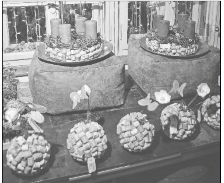
Gebrauchte Korkzapfen als Basis für WEINachtsdekorationen.

Im Innern der Ausstellung fielen – nebst Traditionellem – verschiedenste schöne und teilweise ausgefallene Ideen auf. Besonders ins Auge stachen dieses Jahr die weihnächtlichen Kunstwerke, welche mit allerlei Nebenprodukten der Weinproduktion hergestellt wurden. Weinflaschen in verschiedensten Formen und Farben, Rebenholz- und Geäste, Laub und Korkzapfen, eigentlich alles Dinge, die man nicht auf Anhieb mit Weihnachten in Verbindung bringt, wurden zu Adventskränzen, Gestecken, Kugeln und verschiedensten Weihnachtslich-