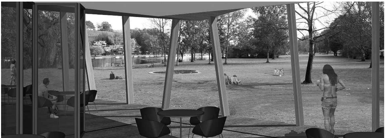
Ausblick vom Restaurationsbereich mit der gedeckten Terrasse.