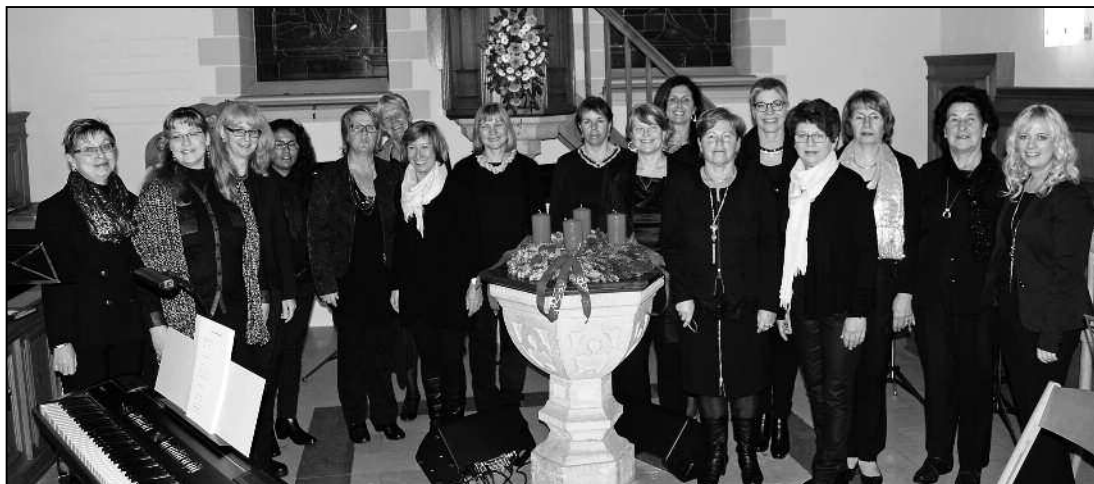
Die Sängerinnen vom ChorIversum – Frauenchor Feuerthalen sorgten für eine schöne Einstimmung in die Adventszeit.

Zu den Klängen von «Away in a Manger» kamen die Sängerinnen, jede mit einer brennenden Kerze in der Hand, von der Empore herunter auf die Bühne und brachten so singend Wärme in das sonst eher kalte Innere der Kirche. In der Folge stiegen Temperatur und Stimmung, denn die Frauen sangen ein abwechslungsreiches Repertoire an Advents- und ande-