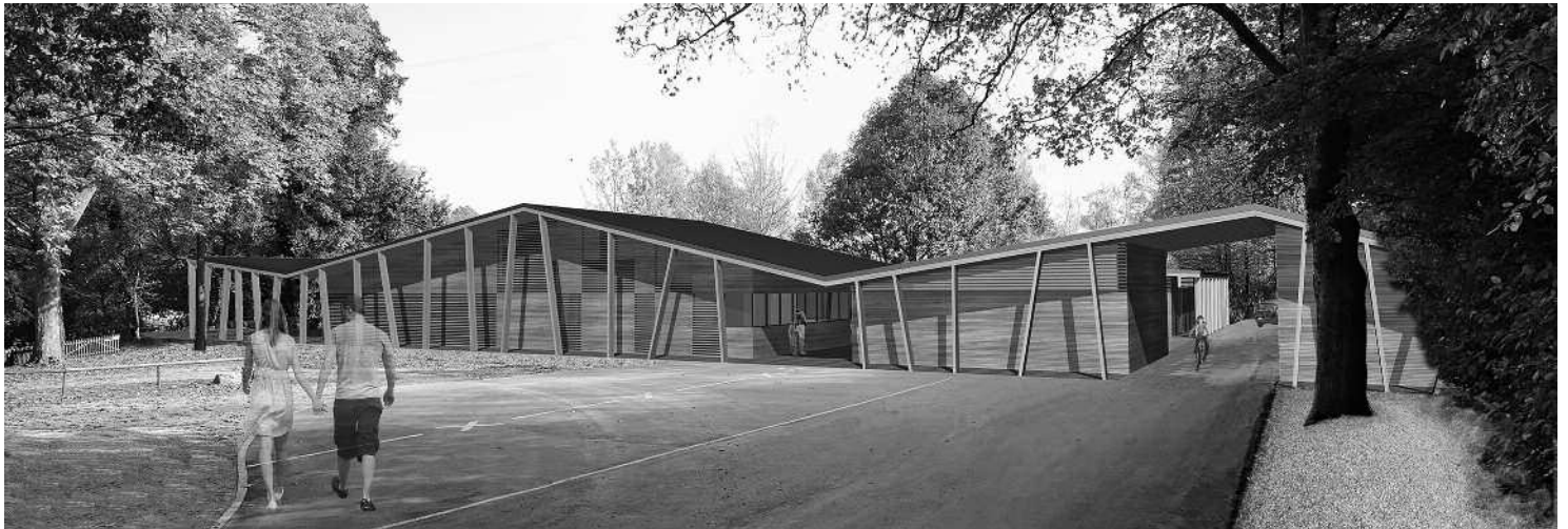
Eingangsbereich der Anlage.

Interessierten die Möglichkeit haben, sich zu den Plänen zu äussern und eigene Ideen einzubringen.