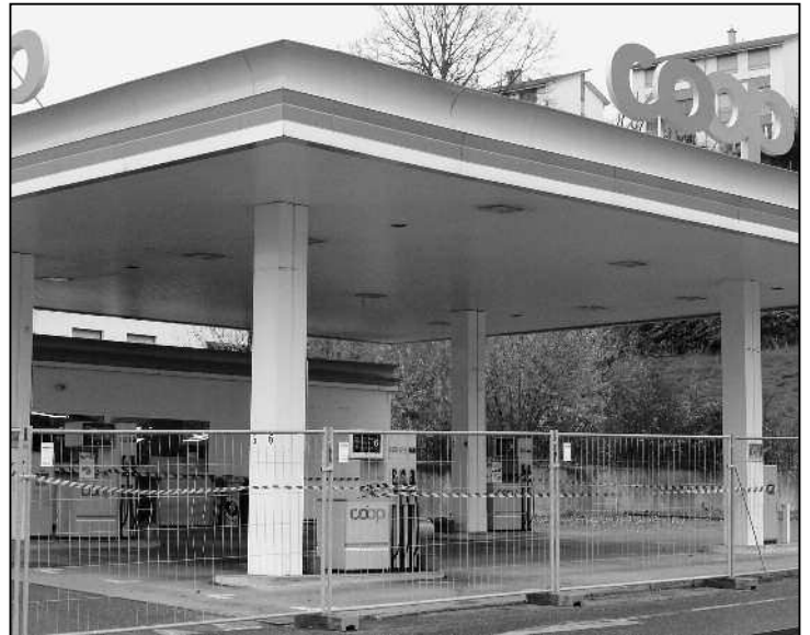
Zumindest für die ehemaligen Angestellten bietet der nun definitiv geschlossene Coop-Shop ein tristes Bild.

Die Kehrseite der Medaille ist natürlich der Verlust der Arbeitsplätze beim Tankstellenshop. Die Tankstelle und der Shop hätten nach der Erweiterung des Rhy Marktes schlicht keinen Platz mehr auf dem Areal, erklärte der