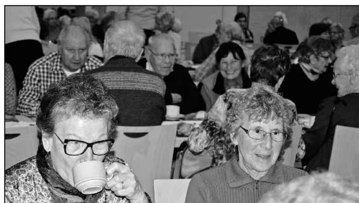
Zufriedene Gesichter beim anschliessenden Kafi.

Wieder einmal konnten die Frauen von der Pro Senectute Ortsvertretung Feuerthalen und Langwiesen zufrieden sein mit dem Programm, das sie ausgewählt hatten. Die Freude darüber wurde auch nicht vom ärgerlichen Umstand, dass die Abwaschmaschine ihren Dienst eingestellt hatte, getrübt. Gemeinsam krepelte man die Ärmel hoch, und in rekordverdächtiger Zeit war alles Geschirr wieder blitzblank!