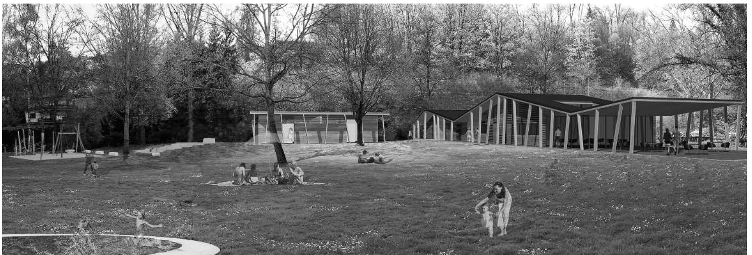
Das Hauptgebäude ist in seiner Form einer Welle nachempfunden.