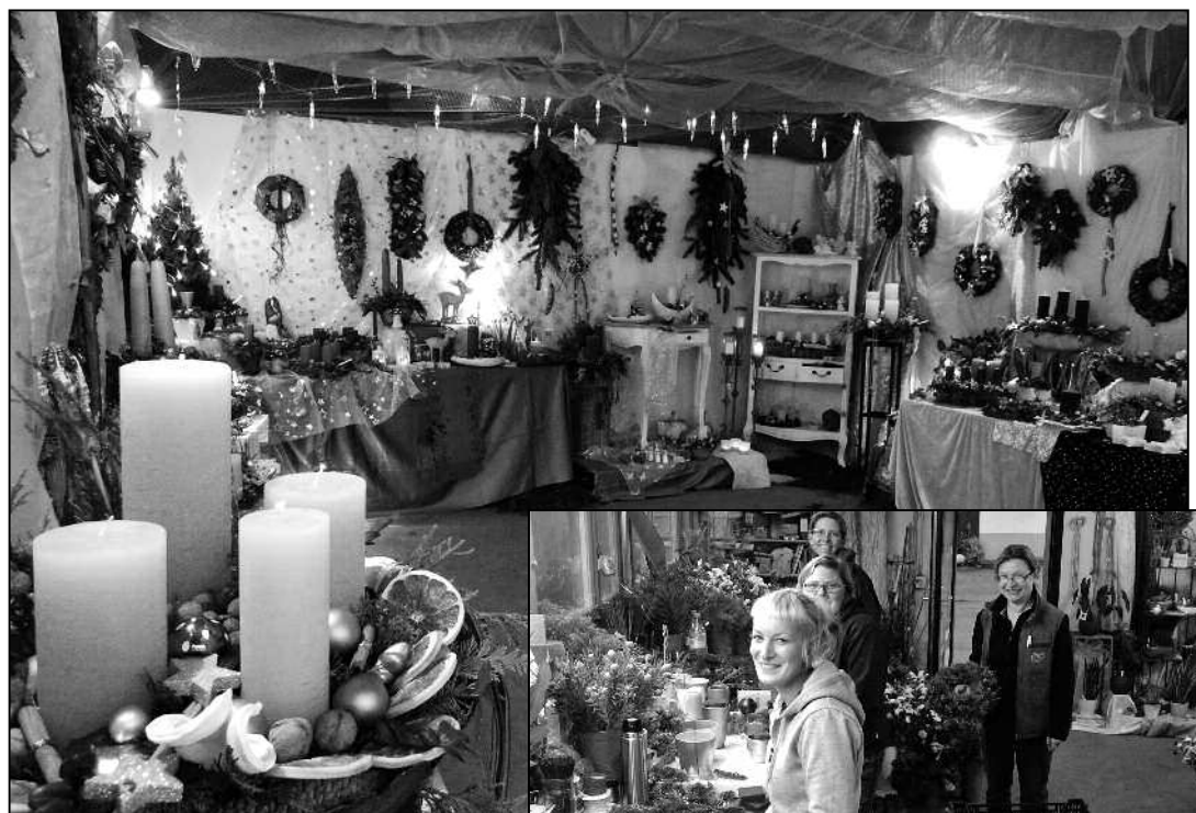
Die Garage wurde dekorativ zum Adventsausstellungsraum umfunktioniert. Der Verkaufserfolg fordert Nachschub: Die «fleissigen Bienen» vom Team der Gärtnerei Fischer sind gefordert.

... an der Hauptstrasse 24 in Langwiesen, vom 24. bis 30. November: Von der Zufahrt zur Gärtnerei erblickt man einen grossen offenen Raum, der mit seinem Schmuck und leuchtender Dekoration den Besucher buchstäblich «gwundrig» hineinzieht. Bei einem leckeren Guetzi und heissem Weihnachtstee ist man von der vom Nebel eingenommen Aussen-