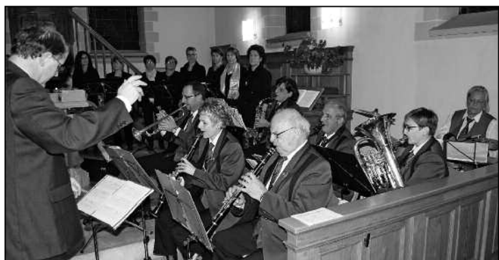
Die Bläsergruppe des Musikvereins Feuerthalen.

ChorIversum – der Frauenchor Feuerthalen tritt übrigens am 13. Dezember um 19.00 Uhr in der Zwinglikirche Schaffhausen und am 14. Dezember um 17.00 Uhr im Zentrum St. Konrad auf, dann zusammen mit dem Männerchor Frohsinn, Schaffhausen.