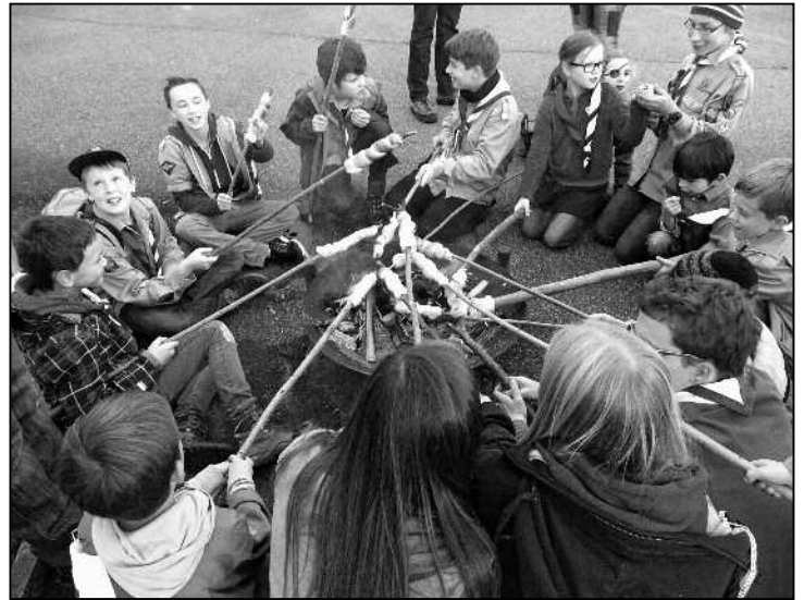
Lustiges Schlangensbrotdräteln am Holzfeuer.