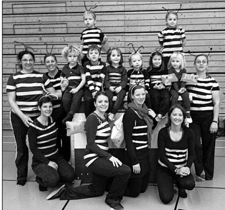
Sind sie nicht süss, unsere Muki-Bienen?

Die ersten Infos erhielten wir schon kurz nach den Sommerferien: Die Gymnastikmatinee Schaffhausen findet wieder im November statt. Da wir leider wieder kein Turnerchränzli auf die Beine stellen konnten, war unser Entschluss schnell gefasst. Wir Feuerthaler Mukis werden auch an der Gymnastikmatinee teilnehmen. Anfang November waren die ersten Proben, die noch etwas chaotisch, aber lustig abliefen. Das Thema «Biene Maja» war allen bekannt, und die Mütter summen fleissig mit, als sie das Lied wieder einmal hörten. Die Kinder waren sofort begeistert und machten super mit. Bei der Verkleidung mussten wir schmunzeln: sollten doch alle Schwimmflügel am Rücken tragen und einen Haarreif mit Pfeifenputzer dran auf dem Kopf. Jetzt sah das Ganze noch lustiger aus! Am Samstag, dem 8. November, war die Haupt-