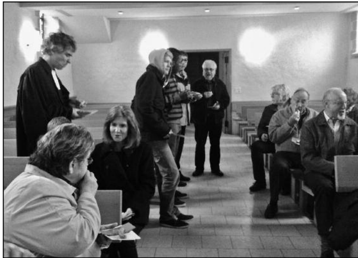
Das grosse Wurstessen.

Zur Geschichte: (Auszug aus dem Gemeindeblatt «reformiert.» lokal Nr. 20) Am ersten Sonntag der vorösterlichen Fastenzeit (9. März 1522) wurde im Hause des Druckers Christoph Froschauer Wurst gegessen und somit das geltende Fastengebot bewusst und in provozierender Weise gebrochen. Der Rat von Zürich ordnete sofort eine Untersuchung über das Fastenbrechen an, als das Wurstessen publik wurde. Zwei Wochen später nahm Zwingli in seiner Predigt zum Fasten Stellung. So wurde der Fastenbruch ein öffentliches Thema. Der Grosse Rat verurteilte zunächst den