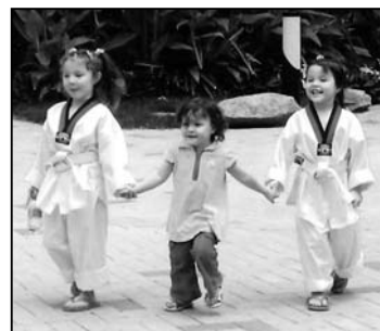
Grosi, wir kommen!