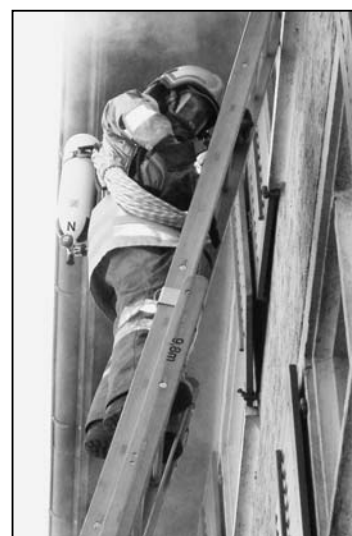
Schwieriger Einsatz mit Atemschutzgerät.

In sicherer Distanz zum Brandort war zwischenzeitlich auch die