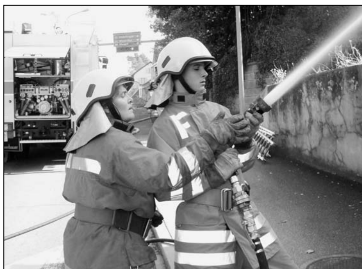
Teamwork – in der Feuerwehr ein Muss!

Zur Personenrettung stehen den Feuerwehrleuten verschiedene, altbewährte und hochmoderne Geräte zur Verfügung. An der «Frohburg» kam nebst der schnell einsatzberei-