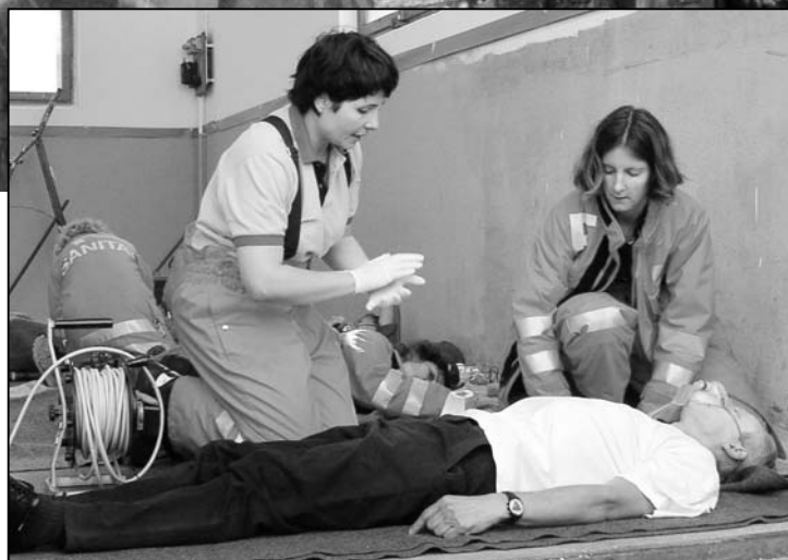
Lebensrettende Erstversorgung in der Sanitätshilfsstelle.