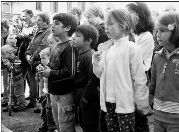
Die Feuerwehrleute von morgen?