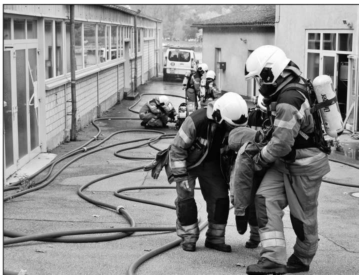
Bergung des Dummies über «Stock und Schlauch».

Ein Kleinbus mitten in der Schiffswerft in Langwiesen steht in Flammen. Rauch steigt auf, die Sicht verschwimmt zunehmend. Der Fahrer des Fahrzeuges gilt als vermisst. Das Feuer greift unerbittlich auf die umliegenden Gebäude und Lagerräume der Werft über, in denen sich weitere vermisste Personen befinden. Nur kurze Zeit später vernimmt man bereits die Sirenen der sich anbahnenden Fahrzeuge der Feuerwehr Ausseramt. Denn um Punkt 14.15 Uhr wurden die Angehörigen der Feuerwehr Ausseramt mittels Pager und SMS zum Einsatz gerufen. Genauer gesagt zur Hauptübung des Jahres, die am Samstagnachmittag vor zwei Wochen stattfand. Und so war der Rauch an dieser Hauptübung zwar echt, das Feuer jedoch nur durch Markierung an verschiedenen Orten erkennbar. Zur Hauptübung an jenem schönen