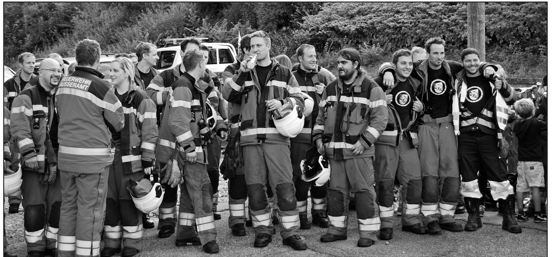
Zufrieden nach gelungenem Einsatz.

Nach rund eineinhalb Stunden war der Einsatz beendet. Die «zackige» Übungsbesprechung hielt Ausbildungschef Oblt. Felix Zulauf, der besonders den guten Einsatz im Gebäude und die reibungslose Rettung des Kameraden über die Schiebe-