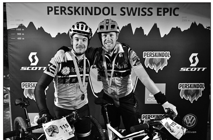
Geschafft – das Feuerthaler «EL ToRo»-Team im Ziel.