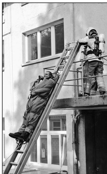
Rettung des verletzten Kameraden mittels Schiebeleiter.