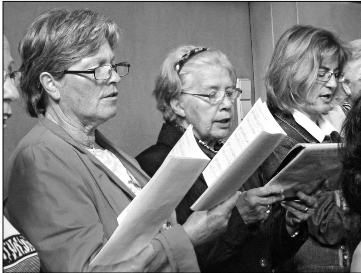
Unsere Sängerinnen geben alles.

Am Sonntagmorgen traf sich eine muntere Schar Chormitglieder samt Dirigent und einigen Begleitpersonen im Turbo Richtung Konstanz. Nach einem gemütlichen Bummel durch die schöne Konstanzer Altstadt spürten wir einen Kaffee-Gipfeli-Trieb in unseren Genen. Da sämtliche Restaurants um diese Zeit noch geschlossen waren, stürmten wir einen winzig kleinen Backwarenladen mit Kaffee-Ecke und brachten das Personal ziemlich ins Rotieren. Die Kaffeemaschine lief heiss, aber dafür stieg die Umsatzkurve des Ladens steil an. Unser nächstes Ziel war die grosse, schöne Münsterkirche, wo wir den Gottesdienst mit unserem Gesang mitgestalten durften. Geplant war eine Vorprobe mit dem Organisten. Dieser sorgte für eine kurzzeitige Verwirrung, als er in der Sakristei verschwand und erst bei Messebeginn wieder auftauchte. Mit seiner Ruhe und seinem virtuosen Orgelspiel lösten sich aber alle Bedenken in Luft auf. Es ist immer wieder spannend, in einer fremden Kirche zu singen, und wenn die Akustik stimmt, macht es gleich doppelt Freude. Nach