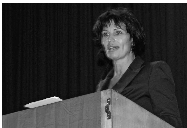
«Wo kommen wir dahin, wenn sich jeder einfach weigert?», Bundesrätin Leuthard ging nicht auf Schmusekurs mit den Weinländern und Schaffhausern.

verbraucht im Jahr rund 6400 Kilowattstunden, ideal hingegen wären etwa 3000 Kilowattstunden» sagte die Energieministerin. Einsparungen sind nötig, weil, gemäss dem bundesrätlichen Papier, Schweizer Kernkraftwerke nur noch so lange am Netz bleiben, wie sie sicher sind. In rund zwanzig Jahren könnten drei oder vier AKWs das Ende ihrer Betriebszeit erreicht haben. Der Einsatz von verbrauchsärmeren Fahrzeugen und Geräten ist dabei ein wichtiger Teil der bundesrätlichen Strategie zur Senkung des Energieverbrauchs. Energetische Gebäudesanierungen tragen ebenfalls zu Einsparungen bei, deshalb sollen auch sie gefördert werden. Um weiterhin im eigenen Land genug Strom produzieren zu können, werde die Schweiz aber auf alternative Energien angewiesen sein, meinte Leut-