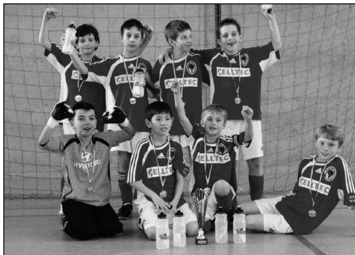
Auch die E-Junioren erkämpften sich einen Pokal.