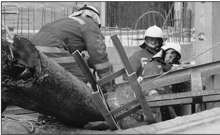
Funkenflug für die Rettung.