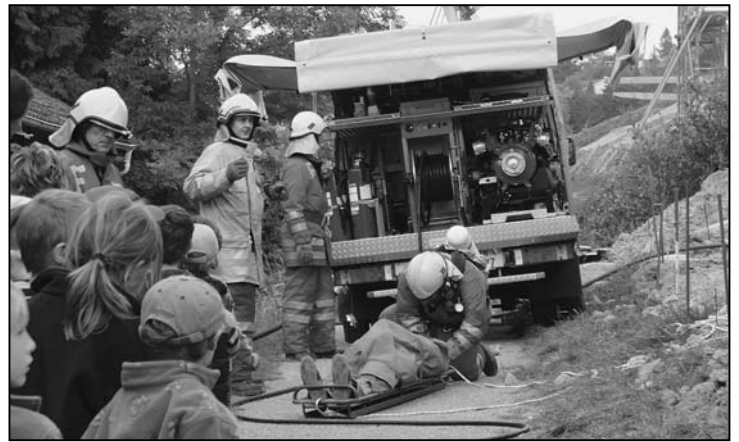
Versorgung eines Verletzten.