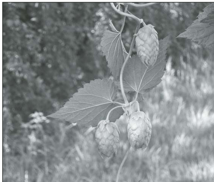
Hopfendolden reif zur Ernte.