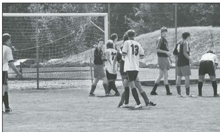
Gehen motiviert in die Jubiläumssaison: die Fussballer des FC Feuerthalen.

Im Jubiläumsjahr wird es wieder ein Auffahrtsturnier sowie einen Sponsorenlauf geben. Eine Gala für aktive und ehemalige Mitglieder und Funktionäre ist am 3. November als Hauptfestakt geplant.