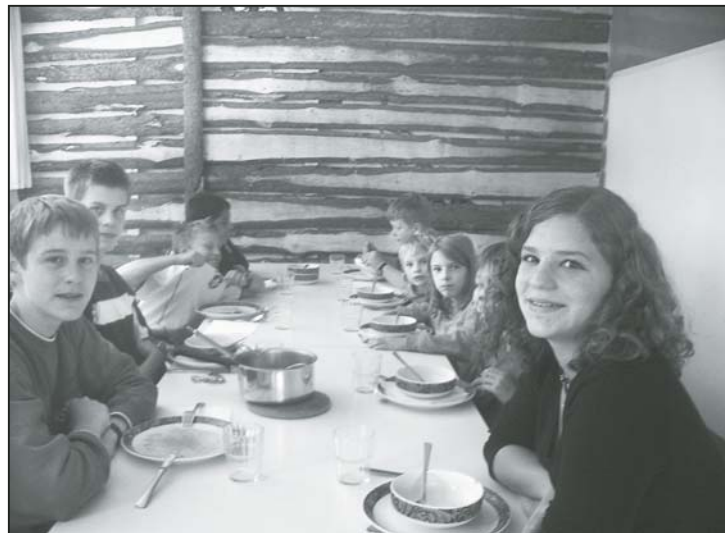
Und, hats geschmeckt?

Schulstunde besuchten, nutzten die Eltern die Gelegenheit, im KiMi-Treff noch eine Stunde zusammensitzen, Kaffee zu trinken und miteinander über die Kinder zu diskutieren. Danach fand dann gleich das erste