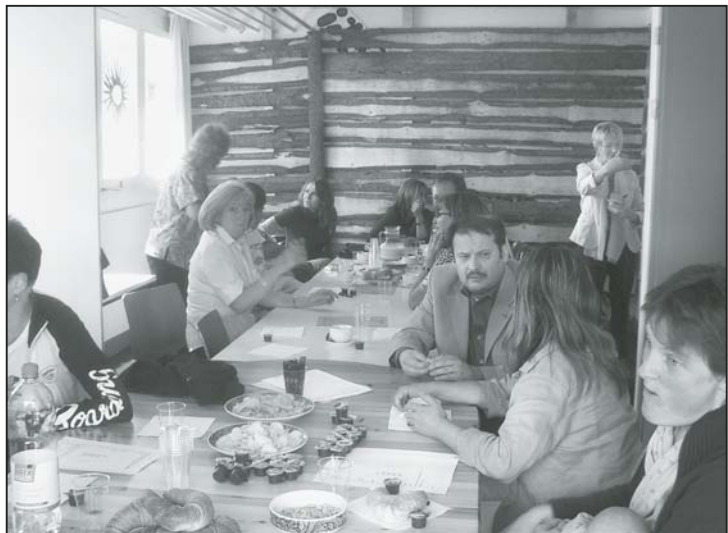
Gedankenaustausch unter den Eltern.