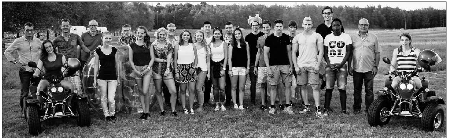
Eine ansehnliche Truppe: Jungbürger und Gemeinderäte.

Die Jungbürgerfeiern in unserer Gemeinde scheinen ein Erfolgsmodell zu sein. In einer Zeit, wo andere Gemeinden in der Region diese Anlässe mangels Interesse der Jungbürger absagen, durfte der Feuerthaler Gemeinderat auch dieses Jahr eine ansehnliche Gruppe junger Frauen und Männer zu einem schweisstreibenden Event begrüßen.