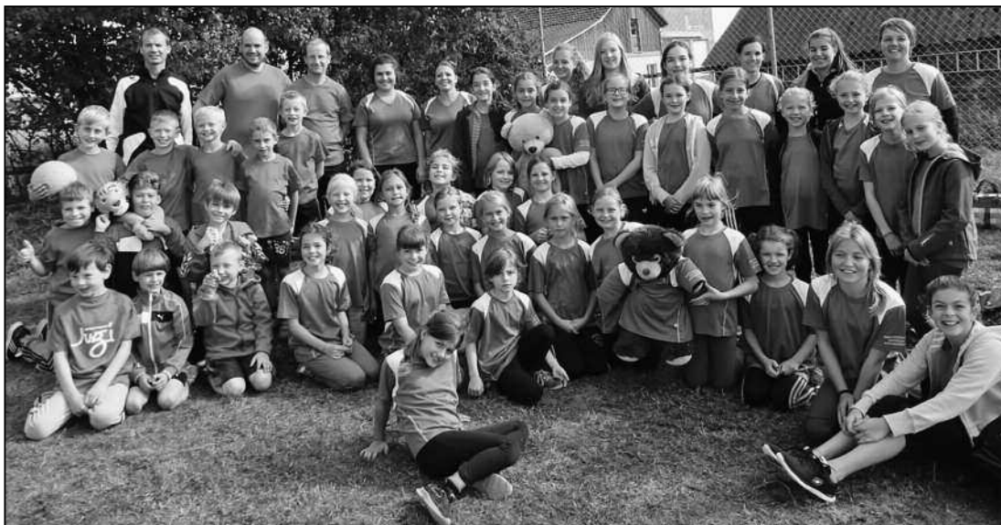
Unsere Jugi und Meitliriege Feuerthalen.

So standen am Sonntagmorgen um 7.30 Uhr bei nasskaltem Wetter fast die komplette Meitliriege und die Jugi am Bahnhof Feuerthalen bereit. Gemeinsam fuhren wir zuerst mit dem Zug nach Schaffhausen und dann mit einem extra reservierten Bus nach Siblingen. Fleissige Helfer hatten für uns unterdessen ein grosses Zelt der Firma Amsler aufgestellt, welches wir bei Ankunft sofort in Beschlag nahmen und unsere Rucksäcke deponierten. Danke der Firma Amsler! Das Gelände war nass und rutschig, sodass alle, die welche dabei hatten, ihre Nockenschuhe anziehen mussten. Ein Znüibrötli und ein Schluck Wasser, ein Apfel oder sonst eine Stärkung, und dann ging es für die Ersten schon los. Ringball für die jüngeren Meitli und Buben, Mini-korbball für die Grösseren. Nun waren die Leiter gefordert. Mit Tipps und Tricks, Spieltaktik (oder auch keine), die Kinder waren schon genug nervös ... Mit einigen Hundert Kindern in Ringball und Mini-korbball und Korbballgruppen verteilt auf 15 Plätzen wurde immer gleichzeitig gespielt, sodass es immer irgendwo jemanden zum «Anfeuern» gab. Oder man machte Pause und tausch-