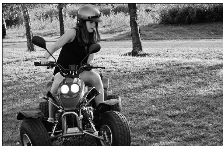
Die junge Frau auf ihrem heissen Stuhl kam der fotografierenden FA-Redaktorin gefährlich nahe.

Bei der folgenden Vorstellung der Jungbürger fiel auf,