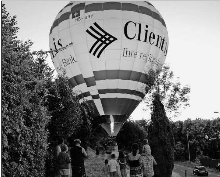
«Tankstopp» auf kleinstem Platz neben der Zürcherstrasse.

Sie war zwar nicht geplant, verlief aber durchaus kontrolliert, die Zwischenlandung des Clientis-Heissluftballons am 30. August in Feuerthalen.