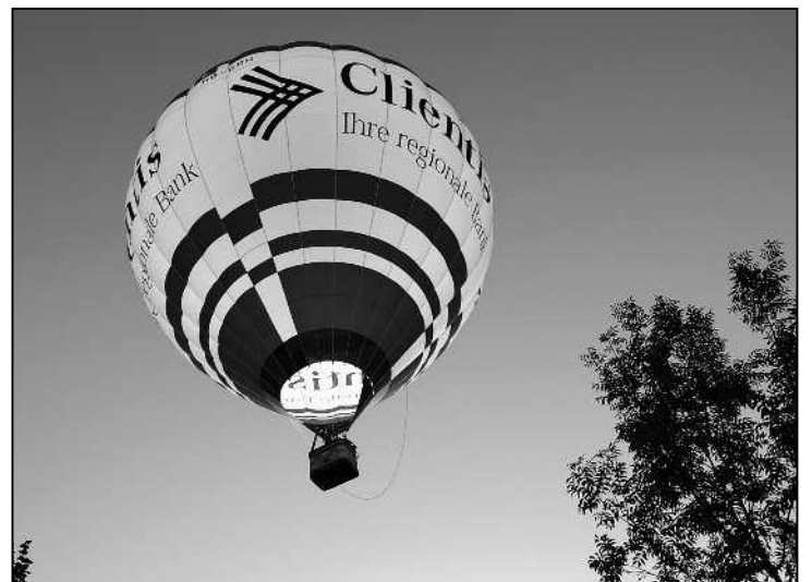
Mit frischem Gasvorrat an Bord entschwebt der Ballon bald wieder.

der majestätisch von dannen. Die Fahrt, welche im Herblingertal ihren Anfang genommen hatte, ging allerdings nicht mehr weit: Wie zwei Tage später in den Schaffhauser Nachrichten zu lesen und zu sehen war, endete sie wegen den anhaltend schlechten Windverhältnissen bereits in Schaffhausen. Am Oerlifallstieg legte Pilot Müller eine ebenso gekonnte Landung auf kleinstem Platz hin wie kurz zuvor in Feuerthalen.