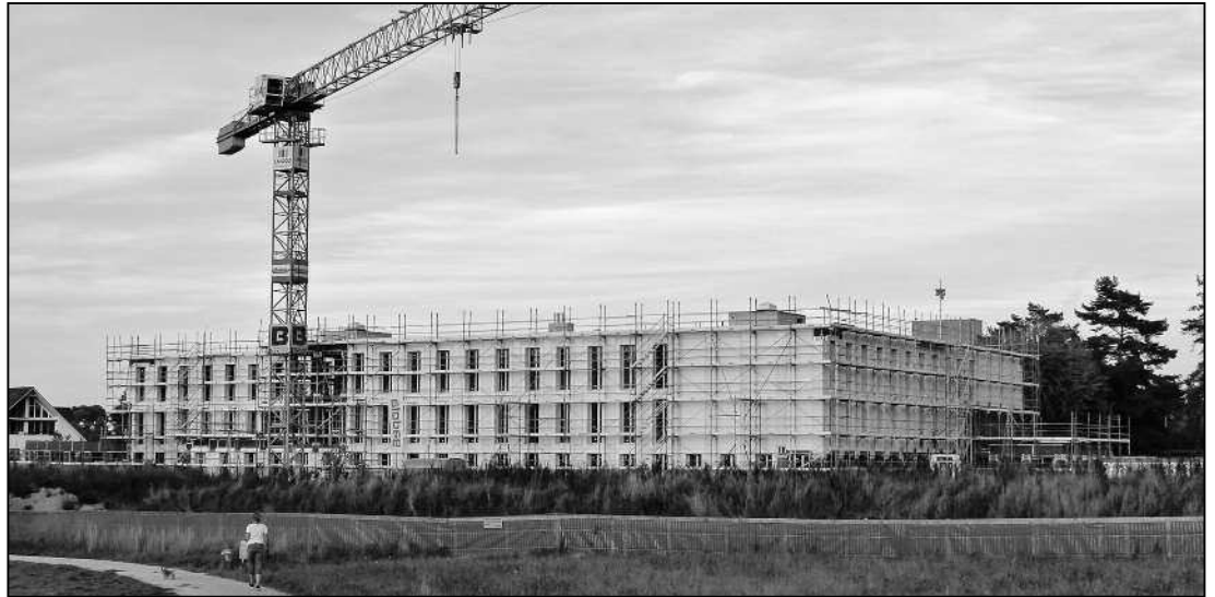
«Die Hülle ist dicht» und der Neubau ist aufgerichtet.