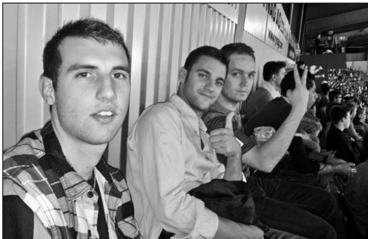
Die Experten analysieren das Spiel.