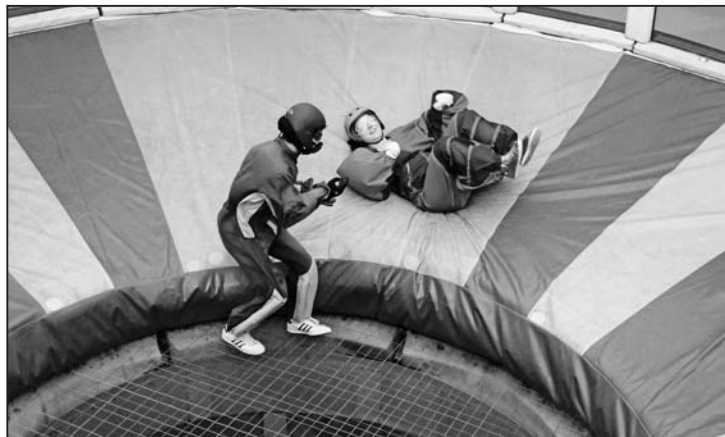
Nach dem Flug fiel man mehr oder weniger sanft auf die Polster.

handelt es sich um ein Restaurant mit amerikanischen Spezialitäten. Auf der Fahrt herrschte eine ausgelassene Stimmung. Beflügelt vom Bordingflug feierten die Jungbürger