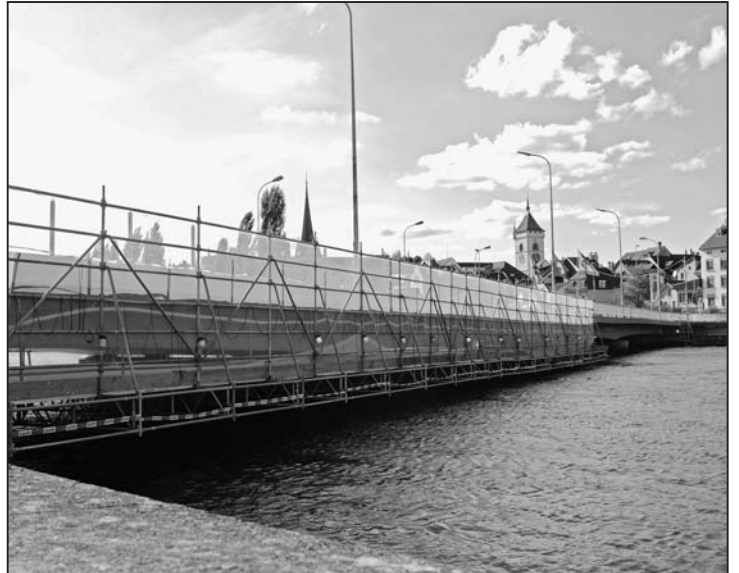
Ein aufgehängtes Gerüst ermöglicht die Arbeiten an der Brückenunterseite.

lokal entfernt worden. Anschliessend wurden die schadhafte Stahlbewehrung und die Quer-Vorspannung erneuert respektive korrosionsschutzgeschützt, bevor dann der Einbau der neuen Abdichtung und Belagsschichten folgte. Auch die Randsteine und die Entwässerungsroste wurden ersetzt und das Geländer überholt. Die Arbeiten an der Brückenunterseite werden mit einem speziell aufgehängten Arbeitsgerüst ermöglicht. Die Tiefbauarbeiten an den Kantonsstrassen Rheinfurterstrasse bis Freier Platz und auf Zürcher Seite der Zürcherstrasse werden mit der Brückeninstandsetzung koordiniert.