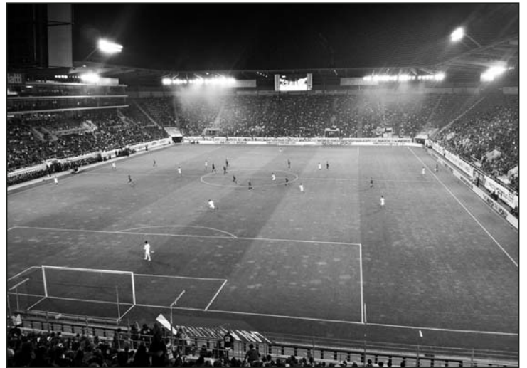
Spanien vs. Chile, ein fussballerischer Leckerbissen.

den Fussballtempel und deckten sich sogleich mit genug ess- und trinkbarer Verpflegung ein. Nebst den kulinarischen Köstlichkeiten konnte man bereits beim Aufwärmen der Teams einige Kostproben der spanischen und chilenischen Spieler geniessen und bewundern. Pünktlich um 20.45 Uhr piff der Unparteiische das Spiel an, und was folgte, bleibt den meisten Anwesenden in guter Erinnerung. Zur Halbzeit führten die Chilenen – etwas überraschend – aber verdient mit 2:0. Zufrieden stellte man in den Feuerthaler Reihen fest, dass auch Stars wie Ramos oder Busquets den berühmten, in der vierten Liga allgegenwärtigen Schritt zu spät sein können.