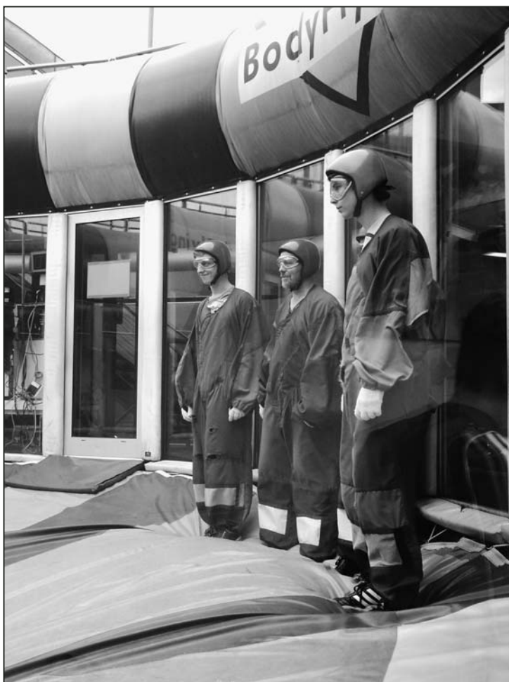
Mit bangendem Blick wird auf das Zeichen des Coachs gewartet.