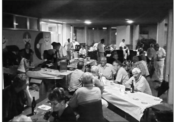
Unter dem Dach war es eng, aber trocken.

Wie bereits bei den letzten Veranstaltungen angemerkt, steht der Musikverein Feuerthalen kurz vor einer Neuuniformierung. Aus diesem Anlass werden auch der gesamte Erlös aus diesem Sommerabendkon-