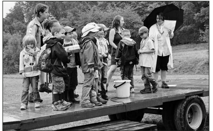
Auch die Jüngsten können Sieger sein.

Die erste Stufe (die jüngeren Kinder) wurde am Sonntagmorgen in Empfang genommen und angefragt, ob sie die grösseren in dieser Situation unterstützen könnten. So mutig und motiviert wie die jungen Pfadis waren, starteten auch sie in den Wald, um die Zutaten zu finden.