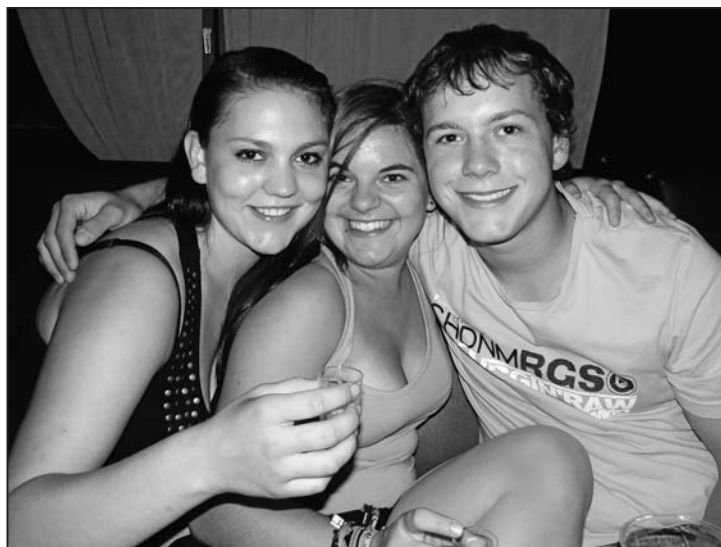
Die Jungbürger geniessen ihre neue Freiheit und feiern kräftig.