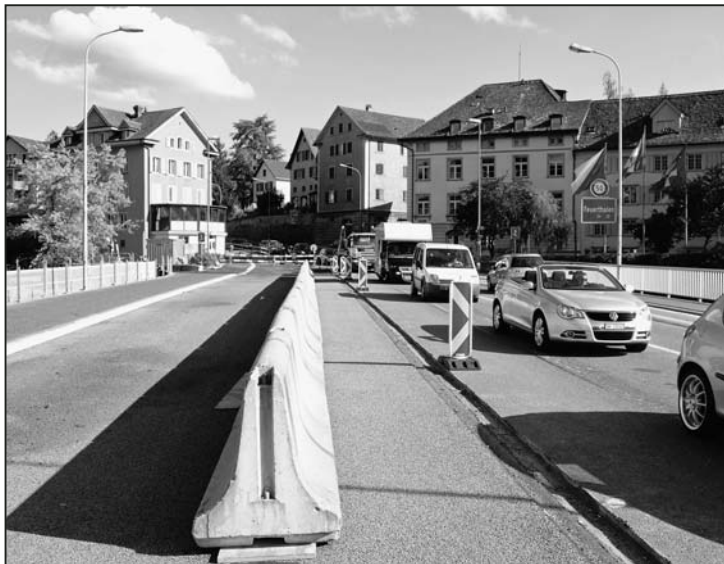
In der ersten Bauphase wurde der flussaufwärtsseitige Brückenbereich saniert. Jetzt werden «die Seiten gewechselt».